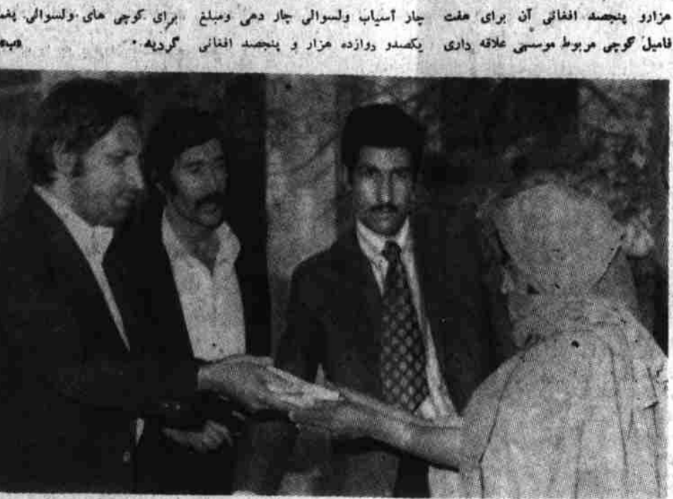
هیات ریاست ضد حوادث صدارت عظمی و ولایت کابل هنگامیکه به یکنوازی اسباب دیدگان کوچی، پول اعتمادی و اتسلیح می نمایند