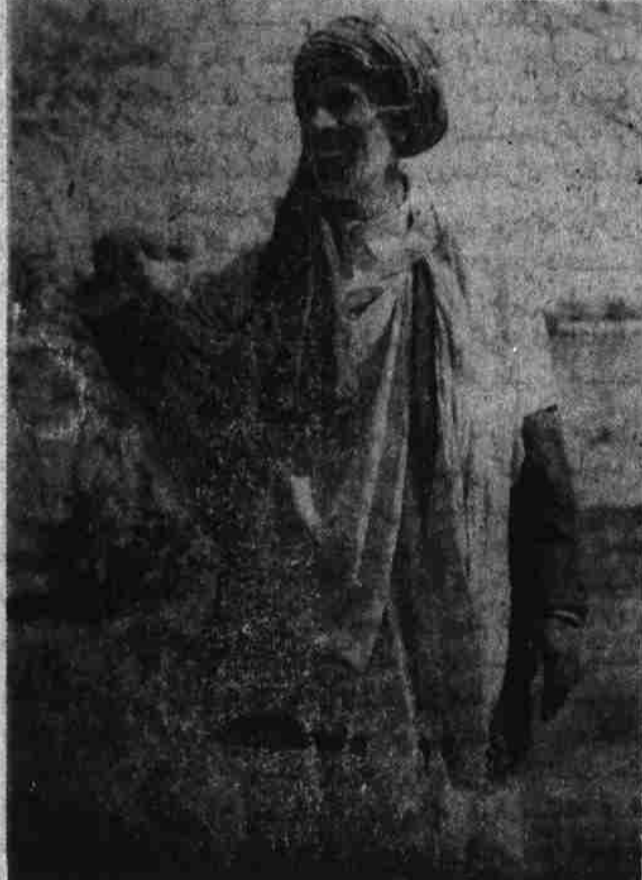
این دهقان میگوید:

يکنيتم هزار افغاني قر ضدار هضم . فرمان شماره ششم من و ديگر مز دورا ن را از قرضداری با داران بکلی معاف کرد که اين خود در حق ما مزدوران بيچاره يك کار خوب و کمک زياد بود که انجام شد بناء از دولت خلقي خودراضي هستيم و موافقتش را در راه به هر دهقان به اندازه ضرورت کمک بيشتر به مز دوران ،