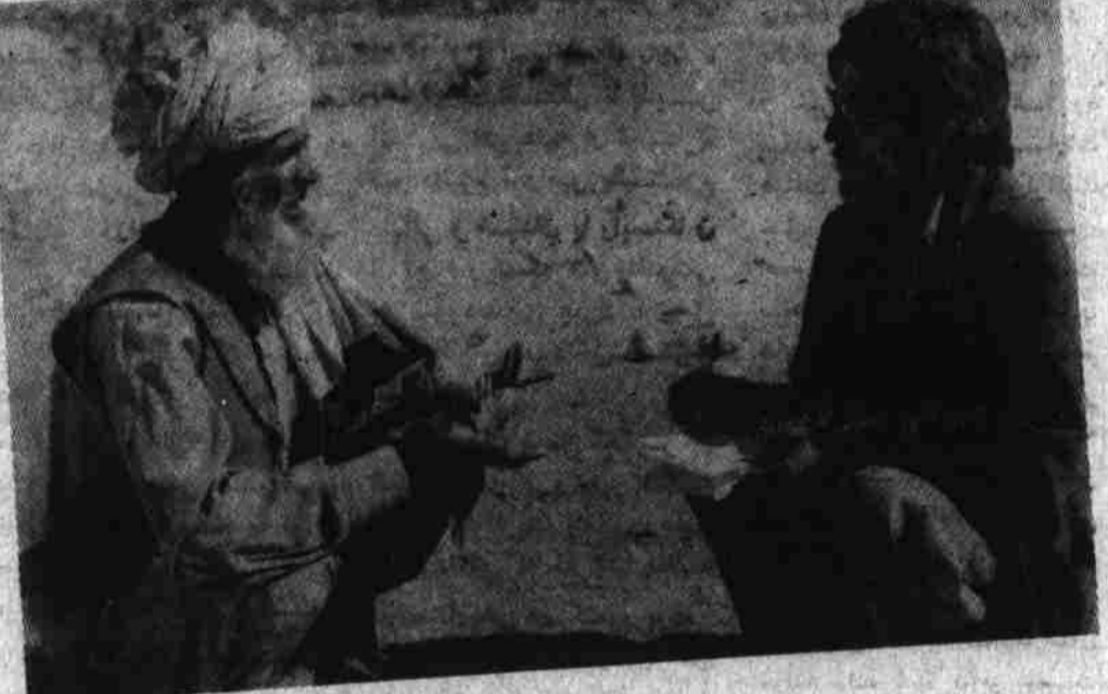
دهقان زحمتکش قرضداری و مشکلات خود را بدون خوف و ترس باز گو مینماید .

چند سال را در مشکلس گذشتا ندیم تا اینکه فرمان شماره ششم به داد ما رسید و زمین ما را که برای چندین سال نزد سود خور بی رحم گرو بود دوباره مسترد نمود اگر چه ما مدتها نماندیم فرمان شماره ششم را به