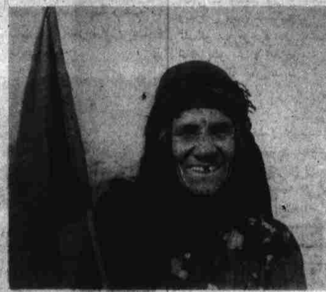
این زن دهقان پیشه میگوید هفت سال است کشتند می دوگری و خوشه چینی میکند

منکو نه قریه بلوچان پشتسئون زرغون معرفی کرده افزود: