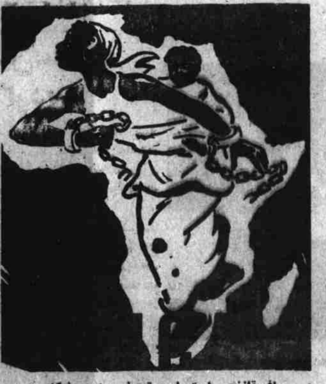
آفریقا زنجیر استعمار و تبعیض را می شکند

با وجود آنکه در ماه ژوئیه ۱۹۷۷ ستارگان ملی متحده فیصله نمود تا هیچگونه نهضات نظامی به حکومت نهضت طلب آفریقای جنوبی فرستاده نشود و از کشورهای عضو این سازمان جنبش های خواست که فیصله نامه های ملل متحد را در زمینه غنای نهایند، با اتم بمب ا صلحه و نهضات نظامی به آفریقای جنوبی روان است. این مطلب را روزنامه پراودا به نشر رسانیده است.