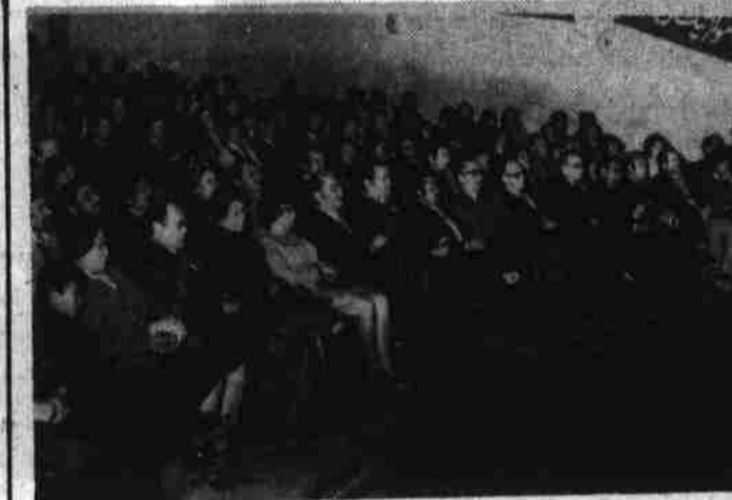
هنرمند مشهور بلغاریایی در حال هنر نمایشی در کابل نتداری

با اجرای نمایشات هنری مشترک هنرمندان بلغاریایی و افغانی ساعت پنج عصر دیروز در تالار کابل نتداری هنر نمایشی گروپ هنری جمهوری خلق بلغاریا در کابل آغاز گردید. بنابعد وزارت اطلاعات و کلتور و سفارت گروپ جمهوری خلق بلغاریا معینان بعضی از وزارت ها و روسای موسسات نشراتی وزارت اطلاعات و کلتور، برخی از سفیرای کشور های متحابه مقیم کابل باخانم هایشان و عده زیادی از معینان برای تماشای نمایشات هنری متذکره اشتراک و زینده بودند.