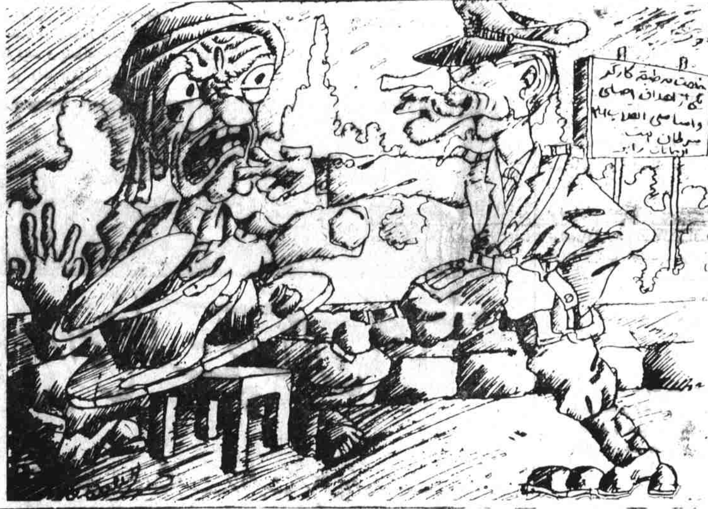
• نادر سخاوتمندانه! چوکی های دولتی را بین نزدیکانش تقسیم کرد.

تا بیخ کوسه می شکند از نادر شاه تا داود شاه بقلم گمشام کرد و تشکیل مجدد شورای ملی است که بر قانون اساسی نام نهاد او صحه گذاشت سلطنت در او خاندان سر دار فیض محمد خان زکر یا وزیر خارجه، سر دار سلطان احمد خان زکر یسا سفیر در ترکیه، سر دار عبدالحسین خان عزیز سفیر در اتحاد شوروی، سر دار محمد داود خان قوماندان نظامی مشرقی، سر دار محمد نسیم خان وزیر مختار در ایتالیه، سر دار محمد قاسم خان حاکم اعلی مشرقی سر دار غلام فاروق خان تائب الحکومه قندهار و سر دار محمد عمر خان والی کابل. اما مولف برای ظاهر داری هم لقب سر دار را از نامهای اشخاص متذکره حذف نمیکند و به این فکر نیست که خود این لقب ثبوت زندگی است برای خویشان خوری خاندان نادری. از کارنامه های نا در که مولف به زکر آنها می برد یکی تشکیل او به جرگه فرمایشی می باشد که سالها ای راعلیه امان الله تصویب همین سر دار شیر احمد خان که بعد از وزیر دولت شد در خانه خود قمار خانه دایر کرد و از قمار بازان نه تنها شیا نه پول می گرفت بلکه به اصطلاح چیز گری هم میکرد یعنی به ایشان پول به سود میداد و بعد ها بزرگترین سود خور کابل یا افغانستان شد و به آنهم اکتفا نکرده به مال مردم خوری پرداخت چنانچه یک لاری مال فیض الدین سلمانی را که در جنب مارکت حاجی امام الدین و شمسی الدین در چار راهی ملک اصغر آتو وقت تازه یک مغازه سه ساله او کس فروشی باز کرده بود با موتر یکجا قوت کرد که داستان طولانی دارد. لیقت محمد حسین خان بعد از اراکین دیگر سلطنت نادری یاد کرده میگویند ایشان همش از روی لیاقت به عهده های مهم مقرر شده اند و سپس از آنها نام می برد. از قبیل