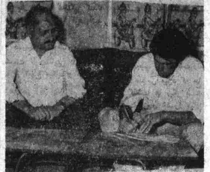
ولسوال بگرامی: کمیته حل مشکلات دهقانی ولسوالی تا حال (۹- اسد ۱۳۵۷) درباره ۳۰۰ قطعه عریضه راجع به گروی زمین فیصله بعمل آورده است.

میکندم بامبلغ سی افغانی به خانه میرفتم و با ده نفر عایله با آن گدازه میکردم. قیل از صدور فر مان شماره شش، حیرا نبودم که بطور از این فلاکت فقر و بدبختی خود را نجات دهم؟ خا لاجدارا شکر میکنم که با صدور این فر مان زمینم از گرو خلاص میشود و من مجبور نیستم که بالای زمین دیگران عرق بریزم و با مزد