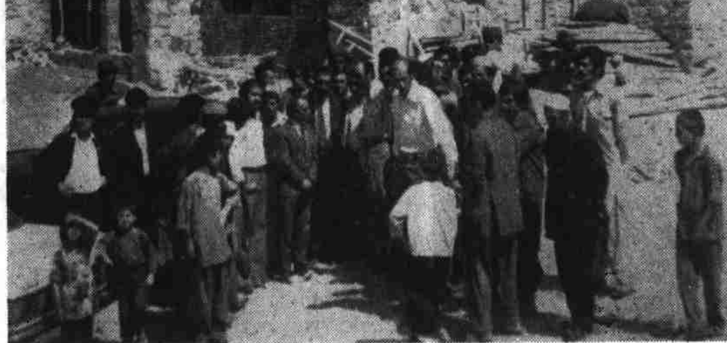
سکرتر جنرال جمعیت افغانی سر همیاشت، مستوفی ولایت پروان حین بازدید از عمارت مرکز امداد اولیه سالنگ

یک منبع مدیریت فواید عامه ولایت پروان گفت کار ساختمان کلینیک امداد اولیه سالنگ که دو ماه قبل به کامه مالی لیک صلیب احمر بین المللی آغاز شده تاکنون هفتاد و پنج درصد تکمیل یافته و قرار است تا یکماه دیگر تکمیل و مورد استفاده قرار گیرد.