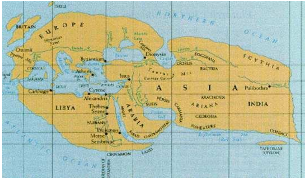
A modern reconstruction of Eratosthenes' ancient world map from 200 BC, using the names Ariana and Persis.

قابل تذکر است که نام قدیم کشور ما آریان یا ایران به حدود هزاره یکم پیش از میلادی بازمی گردد و تا قرن پنجم میلادی به این نام مسما بوده است . که شامل تمام سرزمین های شاهنشاهی : ماد ها ، هخامنشی ها ، پارتها ، کوشانی ها و ساسانی ها (اجداد تاجیکها ، پارسها و کردها ) (1) می شده است.