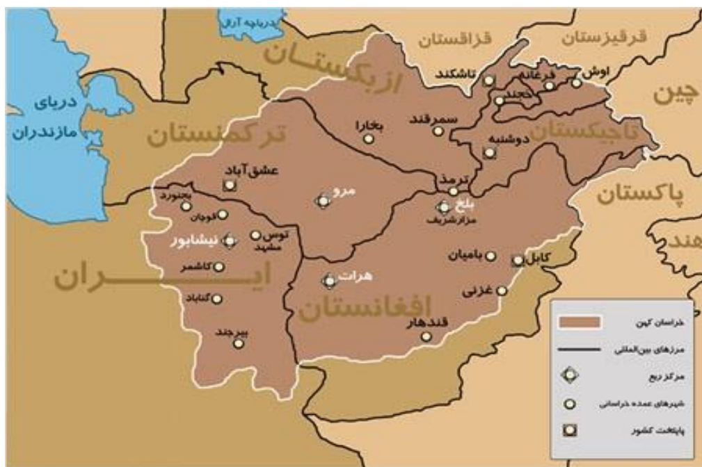
Approximate map of Khorasan and its four main and historical Bukhara, Kabul, Nishapur, Merv, quarters, which are: Samarkand, Herat, and Balkh (in Persian)

اما شاه امان الله و محمود طرزی وزیر خارجه اش در قرن بیستم به سال 1919 جهت تسجیل و قباله این سرزمین بنام اجدادایشان ، اسم خراسان را بدون آراء و همه پرسی مردم ، رسماً و جبراً به اسم افغانستان تغییر دادند. و از آن زمان تاکنون قدرت و حاکمیت دولتی افغانها برای استقرار رژیم تک قومی افغانی ، تحقق برنامه افغانیزه سازی نظام در لباس اسلام با شدت هرچه تمامتر در کشور پیش برده می شود.