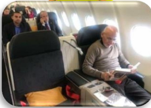
برجسته ترین رویداد این ماه