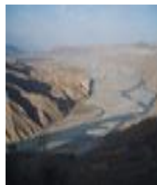
جنگل ساحه ینگى قلعه

جزیره در قد از آنجای که دریای پنج ( آمو) در شمال در قد به دوشاخه جدا شده و در جنوب در قد دو باره با هم پیوست است . جزیره در قد هیچ راه ی خشکه به دیگر نقاط ولایت تخار ندارد و از روی نقشه آن معلوم است که جزیره از سه قطعه زمین هموار به طول چهل کیلو متر و عرض شش کیلو متر در منطقه در قد مرز به تاجکستان در مسیر دریای پنج قرار دارد.