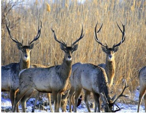
گوزن ها باختری در جنگل در قد