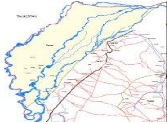
نقشه منطقه جزیره در قد است

در اوسط قرن 20 در نیزار در قد گله های ببر زندگی می کرد از سبب شکار بی رویه آهو , گوزن و کاهش طعمه این جانور نسل ببر در این محل منقرص شده است. گوزن باختری از سبب جنگ داخلی سال 1996 با جا بجای شدن 20 هزار مهاجر اهالی حمام صاب و افراد مسلح در جزیره در قد از عدم فهم در حفظ گوزن های و حیات وحشی این محل شکار آنها را پرداختن گوزن ها پا به فرار به جنگل های تاجیکستان نموده اند. فعلاً در جنگل در قد و ینگی قلعه سیاه گوش , پشی پلنگ , روبا شغال , خرگوش صحرائی دیده شده است . در واقع حیوانات وحشی ارزش و کار کرد مهمی در پایداری جزء های اکوسیستم ها و چرخه های مواد و انرژی دارند. مثل در انتشار دانه ها خسته ی جوندگان در طبیعت و زیر و رو کردن خاک نقش مهم دارند.