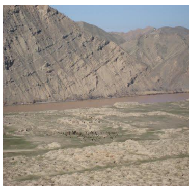
دریا پنج در ساحه ینگى قلعه