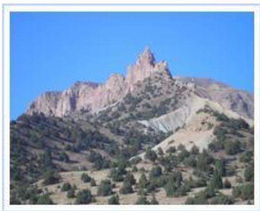
جنگلات پسته بادغیس

جمع آوری حاصل میوه پسته در گذشته سالانه پول هنگفتی را به عایدات دولت می آفرید و هم یکی اقلام عمده صادرات افغانستان در گذشته به حساب می روفت.