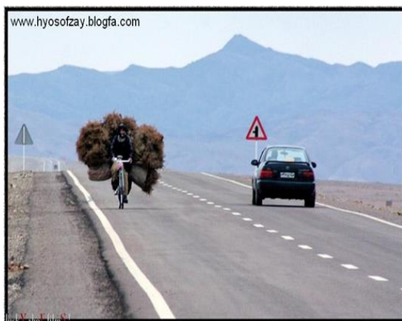
قطع بی‌رویه بته های کوهی

شرایط محیطی چون آب و هوا، باد و فرسایش خاک بوسیله فرسایش بادی در تخریب جنگل اثرات خود را بجا می‌گذارد. وضعیت جنگلات اکثر نواحی افغانستان از عدم بی‌نظارتی مسوولین نواحی در خطری قطع بی‌رحمانه قرار دارد و اگر کدام اقدامی جدی در این مورد از طرف دولت و سازمان های حفاظت از محیط زیست صورت نگیرد امکان دارد در آینده نزدیک ساحات باقی مانده جنگل و سرسبزی از بین برود. همچنان در بخش چرای چارواها به شکل عنعنوی توسط اهالی محل و هم در فصل آمدن کوچی چاروا دار ضرر های غیر قابل جبران را بالای جنگلات وارده نموده است.