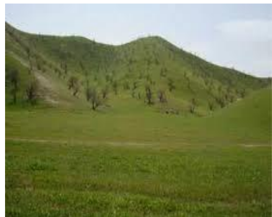
جنگلات پسته تخار

باوصف کمک های جمع جهانی به باسازی وبهسازی افغانستان در قسمت احیای وبهبود پسته زارها اقدامات ناجیزی صورت گرفته ولی بنیادی وبسندده نیست. به دلیل اینکه قبلا اقتصاد ودر آمد سالانه مردم محل به جمع آوری حاصلات میوه پسته وابسط بود. جنگلات پسته خود روی بومی افغانستان یکی از گران بهاترین وزیباترین منابع طبیعی افغانستان است و هم پناهگاه مناسب برای زنده گی جانوران وپرنده گان می باشد. محل های که جنگلات پسته بشکل خود رو