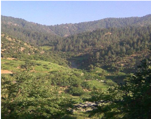
جنگلات کوه کنر

در کنر ونورستان رویده است عمر شان بیشتر از 400 الی 500 سال است. کوه های دره های پنچشیر و دره نجراب ,تگاب , دارای جنگلات بلوط وسیاه جوب بشگل انبوع و بادم کوهی و ارغوان بشکل پراکنده وجودارد.