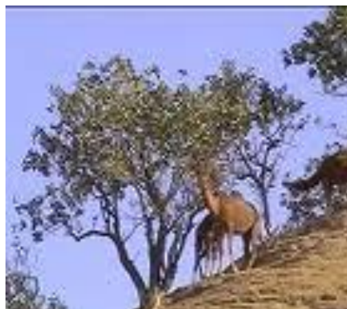
شتر درخت بادم کوهی در یکی از نواحی