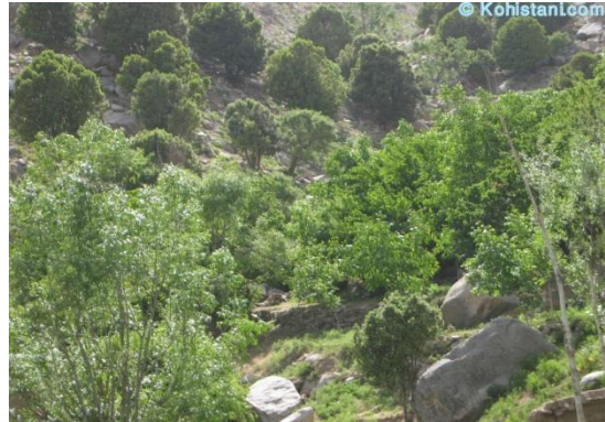
جنگلات کوه پنچشیر

کوه ودامنه کوههای نواحی ولایات افغانستان 450 هزار هکتار پسته زار در گذشته و از برکت طبیعت زیبا وگوارا افغانستان بشکل خود روی جود داشت. از حمله 90 هزار هکتار در کوه دامنه های بادغیس وهرات و 70 هزار هکتار در دامه کوههای سمنگان نواحی , سرپل ماباقی در در دامنه کوههای نواحی بغلان , تخار , بدخشان و بشکل پراکنده در نواحی جنوب شرق کشور نیز وجودارد.