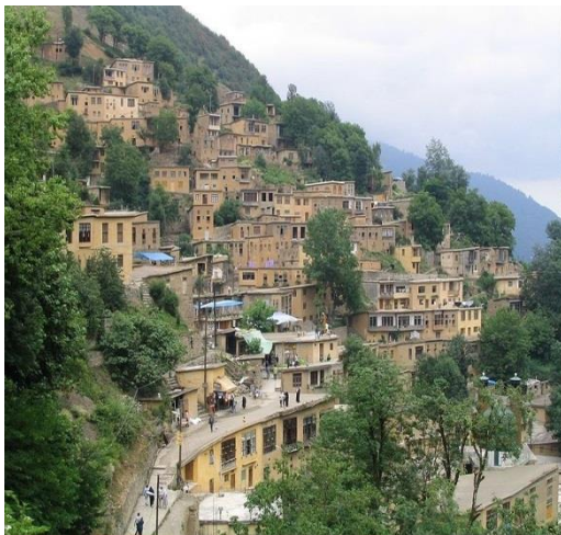
این خانه‌های معماری در ایران

چهار اطراف شهر کابل را کوه‌های صخره‌ای خشک حاری از جنگل احاطه نموده است و هم در میان شهر کابل کوه آسمایی، شیر دروازه، کارته سخی، کوتل خیرخان تپه بی بی مهر و، تپه مرنجان، بالا حصار، کلوله پشته دامنه بادام باغ واقع است که از نگاه طرح و دیزاین در احداث یک شهر زیبا در دامنه این کوه نظیر خود را در دنیا ندارد. اما با تا سف که در طی سیزده سال کابل طبیعی زیبا آفریده صاحب یک مهندس ساختمانی در امور شهر سازی مدرن جهان دیده نشد.