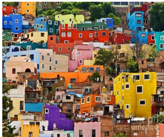
این خانه‌های معمار مکزیکی

امروز وضعیت مسکن در شهر کابل پایتخت افغانستان به سبب بی توجهی شاروالی چنان خراب است که مردم خود سر غیر منظم غیر فنی و بدون نقشه شهر سازی خانه‌های گلی در کوه‌های اطراف کابل به دلخواه خود دست به آبادی و ساختمان سازی زده اند. و برخی از این خانه‌های گلی و سنگی در ارتفاع 500 متر در برفراز و شیب دامنه‌های کوه‌ها از طرف مردم تهی دست بنا شده اند. این خانه‌های گلی خود سر شبیه به قشلاق بدون نقشه بدون مجارای ورودی فاضل آب به لوله و کانال‌ها و خط سیستم شبکه انتقال فاضل آب اعمار شده است.