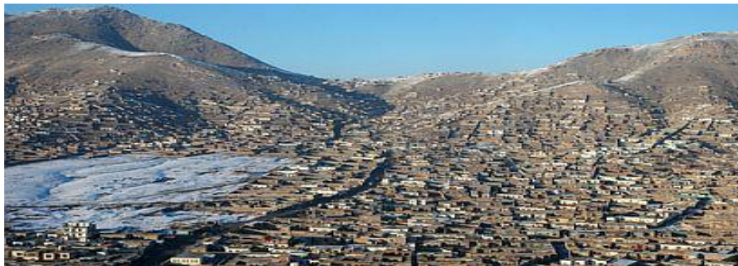
خانه های کوتل خیرخانه

گرده است می توان پیش گیری کرد.وهم با غرس در ختان زینتی در کنار کانال های عبور آب به زابرها کمر بند سبز را ایجاد کرد .