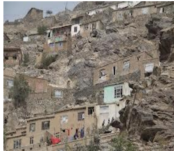
ده مزگ کابل

اکنون با آمدن آب باران گل آلود از ناوه های پشت بام میلیون ها خانه گلی بنای خود سر غیر نقشه و فنی از کوه دامنه ها و تپه های شهر کابل به تندى با خراشیدن سنگ گل از کوچه های خامه به طرف پایین به سرک های پخته و جاده ها می ریزد و در سرک ها و جاده ها گل ولای آن فرش می شود و بعد از خشک شدن آب آلوده فاضل آب در جاده ها ، سرک ها و پیاده رو ها که می ریزد ، باعث مشکلات بسیار چون گرد و غبار در منطقه مسکونی شده است. دلیل اصلی تجمع آب باران در کوچه ها ، در سرک و جاده ها کابل ساخت مجاری ورود فاضل آب کمتر از ظرفیت مقدار جریان عبور از مجار است. از سبب آب های استاده سرک ها مملو از گل ولای شده است و مشکل عبور را برای عابران پیاده و سائپ نقلیه را با مشکلات مواجه ساخته است. و هم سرک ها کمترین ظرفیت عبور مجار آب جویچه ها کانال های کنار سرک ها همه بند می شود آب روی سرک ها آمده و کثافت زیاد می شود.