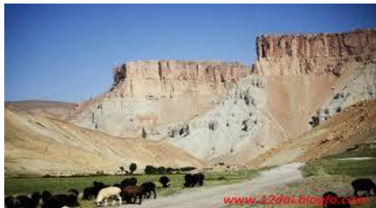
عکس 4_ چرای رمه گوسفند از مردمین محل است

غاصبان قطع و به کلی تخریب گردیده است و ساحات فضای سبز آن تبدیل به زمین کشت زار و هم بعضی دامنه های سبز آن به مناطق رهاشی و قشلاق تبدیل گردیده است.