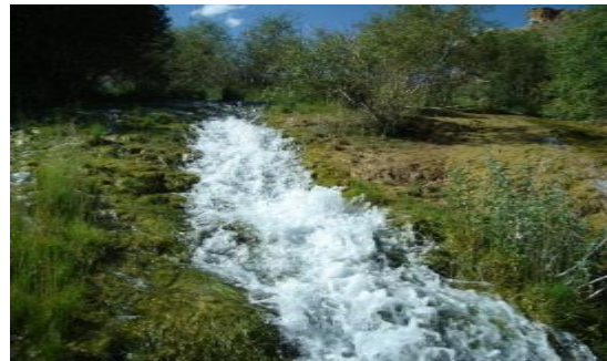
عکس 28 _ ساحه جنگل بند امیر است

پوشش گیاهی در محلی به شرایط آب و هوایی آن محل بستگی دارد و در هر نوع آب و آهوا نوع خاصی از گیاهان رشد می کنند. مثلاً در مناطق مرطوب جنگل دیده می شود میدانید که جنگ در محلی است که درختان بصورت خود رو و در کنار هم قرار دارد درختان جنگل ممکن است به هم فشرده باشند یا از هم فاصله داشته باشند. در قسمت مرتفع کوه ها یا دامنه ها به جای جنگل گیاهان کم ارتفاع می روید و به این نوع پوشش گیاهی جمنزار می گویند.