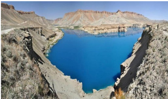
عکس 29_ یکی از نمونه ای جهیل های بند امیر است

و با فرسایش خاک باران شدید موجب رواناب و سیل می شود و سیلاب جهیل ها, سد ها, نهره ها, جوی های عنعنوی و کاریز ها را پر می کند. و همچنین پوشش گیاهی با گرفتن اولیه قطرات باران از ضرب مستقیم قطرات و در نتیجه متلاشی شدن ذرات خاک جلوگیری می کند. و ریشه گیاهان از حرکت و جابجایی ذرات خاک توسط آب و باد جلوگیری می کند. شدت فرسایش خاک در کوه ها بعلت داشتن شیب بسیار بیشتر است. شیب زیاد باعث تسریع جریان آب شده به همان نسبت میزان هدر رفتن آب افزایش پیدا می کند. به همین علت پوشش گیا هی در مناطق کوهستانی از اهمیت زیادی برخوردار می باشد. علاوه بر آن پوشش گیاهی در منطقه باعث حفظ و نگهداری رطوبت خاک می شود. رطوبت خاک است که مسله موجبات امکان حیات بوته ها و زندگی هزاران نوع حشره و میلیون ها میکرو ارگانیزم را فراهم می آورد. که این حشرات علاوه بر اینک امکان حیات پیدا می کنند. از بین رفتن پوشش گیاهی باعث کمی رطوبت در محل می شود و روند فرسایش خاک شتاب بیشتری می گیرد و در کیفیت آب رود خانه ها تاثیر می گذارد و به ماهیان و سایر مرغان آبی آسیب فراوانی وارد می شود.