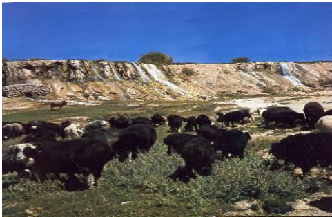
عکس 31_ چرای گوسفندان در بندامیر

جهیل ها و نگهداری پوشش گیاهی این منطقه از گزند چرای حیوانات ضرور است. و ما باید مانع از چرری حیوانات اهلی گوسفند و گاو بخصوص بز مزر ترین حیوان در برهنه کردن کوه ها از پوشش گیاهی به شمار میرود در این مناطق شویم .