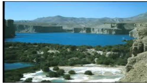
عکس 20_ آهک درآب ریخته است جوش دارد

جدار های اطراف که اکثراً جهیل ها از سنگ های رسوبی تشکیل یافته است بطور طبیعی ساختمان های بسیار زیبا و دیدنی را به وجود آورده است که شکل کنونی این جداره ها جذابیت منظره مذکور را دو چندان کرده است.