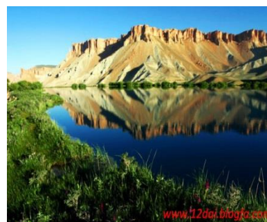
عکس 5_ یک از هفت جهیل بند امیر اطراف بند امیر

جهیل ها بند امیر نیز نقش موثر در جلوگیری از گسترش کویر های صفات شمال غرب کشور ما و همچنین در تغذیه آب های زیر زمینی منطقه نقش موثری را ایفا می کند. علاوه بر این در بهبود و بهسازی وضعیت اقلیم مناطق مرکزی کشور وهم در جلوگیری از فرسایش خاک وکنترول سیلاب منطقه و بخار آب این جیل ها در سرسبزی منطقه نقش اساسی دارد.