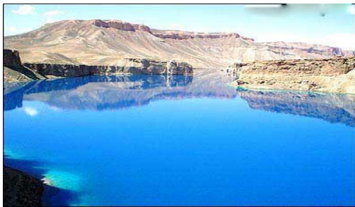
عکس 21_ جدار جهیل سالم است

در طی این چند دهه ریزش و لغزش خاک آهک در اثر رفت آمد حیوانات محل در داخل جهیل ها موجب بخارشدن قسمت از آب بعضی جهیل ها شده است.