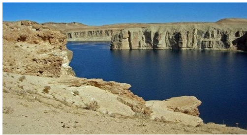
عکس 25_ جهیل که داری عمق زیاد اس

آب این جهیل ها نسبت تماس آنها با ترکیبات آهک موجود در زمین باعث سختی آب آن شده و آب های سخت برای آشامیدنی مناسب است. مطالعات نشان داده که آب های سخت به علت وجود منیزیم و کلسیم مرگ های نگاهانی ناشی از امراض قلبی و عروقی را به شدت کاهش می دهد.