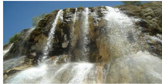
عکس 24_ آبشار بند امیر

2. خاک یک تکه سنگ خرد شده است ویژگی مهم این است که زنده است و موجودات زنده را می پروراند که مثال بارز آن گیاهان است . خاک یکی از محصولات محیط است که دائماً در معرض تغییر و نمو قرار دارد. خاک همیشه و در همه حال توسعه می یابد یا به حوصله یا به آهستگی در مناطق خشک و مرطوب سریع . خاک ساحه بندامیر آهک و گچ است و با بی جا ساختن و کندن بی رویه آن خصوصیات فیزیکی خاک ( بافت , ساختمان , رنگ ) تخییر می خورد. ریزش خاک آهک در آب جهیل آب جهیل را گرم می کند و موجب بخار شدن آن می گردد و در نتیجه آب جهیل کم و خشک شد است و این خاک مرده آهک توسط باد به اطراف جهیل های هم پیوند آن می رسد و این عمل به گیاهان اطراف جهیل ها اثرات غیر مطلوب را به جای می گذارد و گذاشت است که جهیل های بند امیر درحالت نابودی هستند.