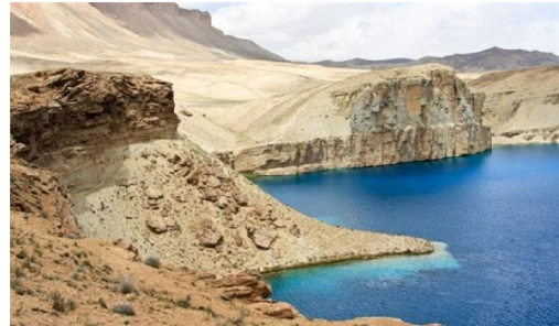
عکس 30_ نقاط آسیب پذیر بندامیر

موجودیت این چنین سد های آبی طبیعی در پهنهء جغرافیای خشک و لامزرور سلسه کوه هندوکش مرکزی ، حامی و حافظ مطمئن برای حفاظت و مصونیت از طبیعت زیبا منطقه مرکزی افغانستان است وهم مژده رسانی از محیط زیست سالم گرد و اطراف مناطق خود جهیل ها بوده، اعتدال اقلیم این ساحات مرکزی و شمال غرب کشور را بیش از پیش تأمین می نماید.