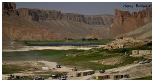
عکس 3_ قشلاق است که طی این دو دهه نوع تشکیل شده است

امروز تشکیل این قشلاق جدید با عث تهدید مدهش و آسیب زیست محیطی جهیل های بند امیر شده است و وظیفه اداره ملی محیط زیست به همکاری نهاد های دولت درکشدن این غاصبان از این ساحه وهم در توقف کشت زمین های زراعتی غیر قانونی هرچه زوتر چه توسط قانون و چه از نگاه وظیفه انسانی توجه جدی نمایند . چون ساحات و جدارهای جهیل ها از خاک آهک به شکل طبیعی تشکیل یافته است و بر اثر رفت و آمد زیاد آدم ها و حیوانات جهیل ها بند امیر در معرض تخریب و تهدید جدی قرار دارند. این جهیل های روزبه روز زیبایی نقاط برجسته اکولوجیک و ارزشهای ملی بین المللی خود را از دست داده روان است.