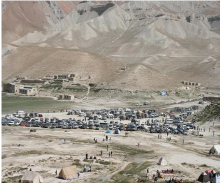
عکس 15_ ازدحام وسایط و گردشگران