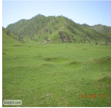
عکس 9_ پست زار ولایت بادغیس