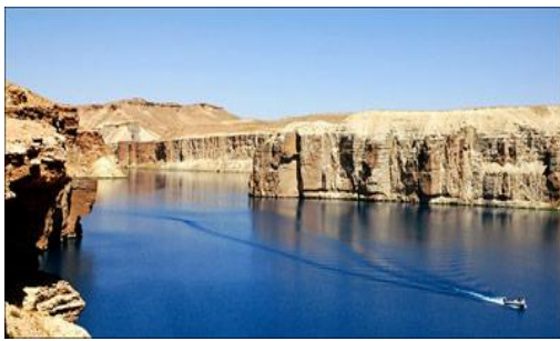
عکس 17_ راندن قایق موتوری است

3. راندن و گشت قایق های موتوری که باعث حرکت نوسانی سطح آب و این حرکت سبب تخریش دیوار آهکی اطراف جهیل ها و هم حرکت موج آب رسیدن آن به جدار دیوارهای آهک باعث گرم شدن آب و موجب بخار آب می شود و هم راندن قایق های موتوری باعث آلوده شدن آب ذلال این جهیل ها با روغن ( تیل) می شود. سر منشأ تهدیدات زیست محیطی به دست انسان است