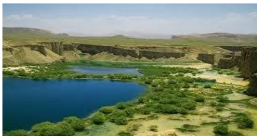
عکس 2_ یک گوشه منظره سبز جهیل است

جهیل های بند امیر یکی از جاذبه های طبیعی در افغانستان هستند. و در جمله مرآت طبیعی جهان قرار دارند , آب لاجوردی آن در هیچ کجای دنیا نیست و یک امتیازات دیگر آن آبی که از عمق زمین عصر ها است که می جوشد از لایه های سنگ آهکی بیرون می آید . جهیل های بند امیر میلیون سال پیش به اثر واقعه ای شگفت انگیز طبیعی درمقابل جریان آب سد گردیده است و آب جهیل ها از سبب آهک بودن سقف جهیل ها به رنگ آبی لاجوردی می درخشند. زلال بودن آب این جهیل ها جهان گردان را در سابق به خود جلب کرده بود و آب آن آشا مید نی و شفا بخش جلدی است و به دلیل مخلوط بودن آن با عنصر گوگرد. عنصر گوگرد در طبیعت به طور خالص با همراه دیگر مواد یا به صورت سولفورها یافت می شود .