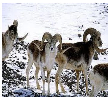
عکس 6_ قوچ های کوهی اطراف بند امیر