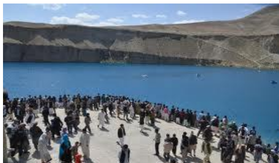
عکس 12_ ازدحام افراد گردشگر در یک محل خورد

1. عدم رعایت استاندارد های زیست محیطی در ایام فعالیت های گردشگری یکی دیگر عوامل آسیب رسانی به محیط زیست جهیل ها است. این آداب و رسوم گردشگری شلوغی، هیاهو باعث برهم زدن نا آرامش زیست محیطی می شود و هم سبب آسیب رسانی به جزء های اکوسیستم جهیل ها بند امیر می شود. هجوم بیش از حد و از دحام آدم ها، وسایط شان به طبیعت جهیل های کوهستانی بند امیر آسیب های فراوانی را می رساند از آن جمله باعث لگد مالی فضای سبز جهیل ها شده است و سبب رانش سنگ آهک و ریزش روسوبات آهک به داخل جهیل ها و هم رعایت نکردن نظافت و ریختن و بجا گذاشتن زباله های تجزیه نشدنی در محل یاریختن آنها به داخل جهیل ها و هم ایجاد سر و صدای به وسیله موتور سیکل ها، موترها و محیط آرامی کوهستان را برهم می زده و سبب نا آرامی پرنده گان و مزاحمت در حیات وحشی منطقه می شود.