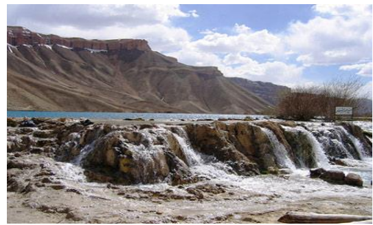
عکس 22_ دیوار از سنگهای رسوبی بطور طبیعی تشکیل یافته است

بند امیر یک سد آبی ذخیروی نعمت خدا داد است در تولید رطوبت به طبیعت زیبای ولایات مرکزی ولایات شمال غرب کشور ما و از چند جزء اکوسیستم کوهستانی خاص طبیعی تشکیل یافته است اگر به یکی از جزء های آن به اثر عمل کار نا آگاهانه انسان آسیب رسد و به دیگر جزء های آن هم نیز آسیب می رسد. اکوسیستم کوهستانی جهیل های بند امیر حساس آسیب پذیر و شکننده است به دلیل وجود شیب دره ها ، یالها ( گردنه ها) وضعیت پیچیده ای را در محیط خود