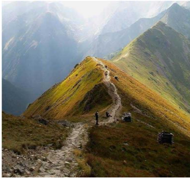
عکس 10_ پوشش گیاهی کوبابا