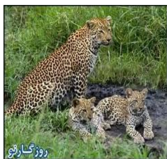
عکس 7_ پلنگ های های

جهیل ها بند امیر صندوق جوهرات اکوسیستم منابع طبیعی ارزشمند مناطق مرکزی افغانستان هستند که باوجود منظره دلکش جهیل ها آنها با خود راهایی , تنهایی را خوش دارند. این جهیل ها که مهد جای گاه دگر گونی زیستی یاد می شود که با فراهم ساختن آب و قابلیت زاد آوری رول مهم در دوام زیست گونه های بی شمار گیاهان و جانوران و بخصوص حیوانات وحشی ( بز کوهی , قوچ کوهی , پلنگ و غیره ) ایفا می کنند. این جهیل ها روزانه یک مقدار زیاد حرارت هوا را جذب کرده و در اثنای شب آن را دوباره آزاد می کند و بدین صورت از شدت گرمی روز و سردی شب تا حدود کاسته وامکانات زندگی را برای نباتات و حیوانات در محیط اطراف خود مساعد می سازد.