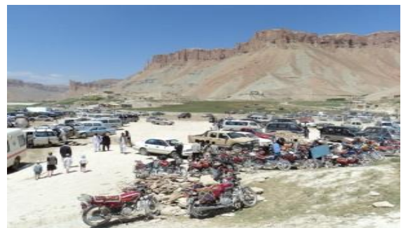
عکس 11_ بیرباروسایط موترها

2. استقرار پروژه های عمرانی در حاشیه جهیل های کوهستانی بدون مطالعه و ارزیابی متخصص محیط زیست معمولاً آسیب خسارات زیاد را به پیکر طبیعت جهیل ها وارد می کند و از آن جمله ایجاد قشلاق یا قریه، احداث جاده ها و پارکینگ وسایط در حاشیه جهیل ها بند امیر از جمله شاخص تهدیدات زیست محیطی است. اگر جلو خود سری اعمار این پروژه ها به زودی از طرف دولت گرفته نه شود خسارات زیادی را به پیکر طبیعت این جهیل وارد خواهد کرد.