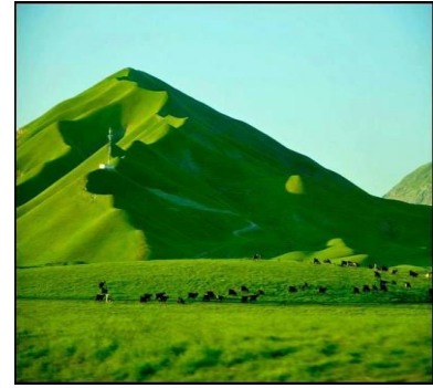
عکس 8_ بهار یکی از نواحی ولایت جوزجان

فعالیت خود سرانه انسانی که از اثر بی نظارتی و عدم مسولیت اداره ملی محیط زیست که امروز موجب تهدیدات زیست محیطی جهیل های بند امیر شده عبارتند از: