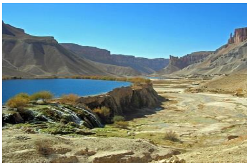
عکس 23_ دیوار بند از سنگ روسویی است

جدار های اطراف که اکثراً جهیل ها از سنگ های رسوبی تشکیل یافته است بطور طبیعی ساختمان های بسیار زیبا و دیدنی را به وجود آورده است که شکل کنونی این جداره ها جذابیت منظره مذکور را دو چندان کرده است.