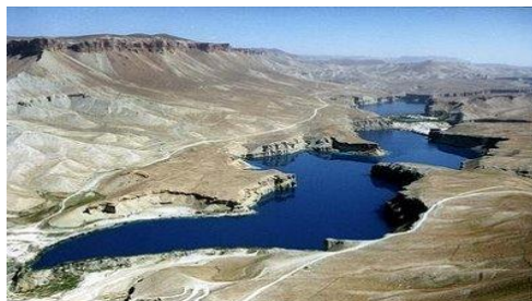
عکس 1_ بزرگ تیرین جهیل آن

آب این بند ها از دره آب قول کوه بابا که تقریبا 9 مایل از بند امیر فاصله دارد سرچشمه می گیرد و با پر نمودن جهیل های بند امیری به طرف غرب بسوی دره بلخاب جریان یافته است و رود ها خورد و کوچک که از سلسله های کوبابا می ریزد و در ساحات ناحیه بلخاب با هم یکجا شده و در مسیر خود باغات و صحرای وسیع زراعتی را آبیاری می کند و در مزار شریف معروف به هجده نهر بلخ است . دریای هجده نهر بلخ در فصل بهار آب فراوان دارد , اما در فصل تابستان دهقانان و باغ داران از کم آبی درکشت کار خود اکنون شکایت دارند.