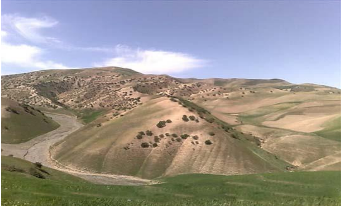
جنگلات پسته تخار

ولایت بغلان یکی از ولایات شمال شرق افغانستان می باشد که دارای موقعیت خاص جغرافیائی می باشد ولایت بغلان دارای جنگلات طبیعی پسته ، ارچه ، بادام کوهی و غیره بوده و نیز دارای منابع آب فراوان و علفچرهای وسیع برای مواشی است. در این در حدود 20 هزار هکتار جنگلات پست بشکل انبوه و پرگنده در ارتفاعات بلند و دامنه های کوه های این ولایت موقعیت دارد.