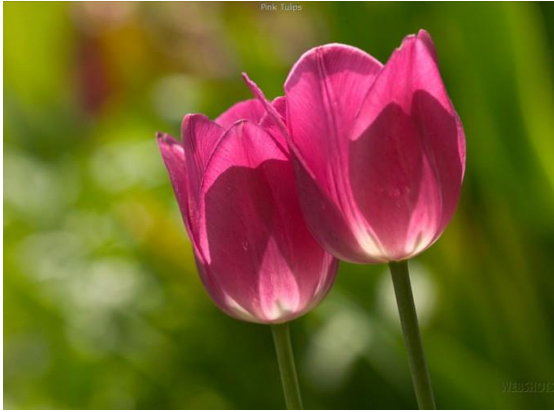
لاله سرخ رنگ (قرمز)