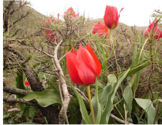
لاله رنگ لعل پیازی

شمالی عبارت از پنجشیر، کاپیسا، پروان و قسمتی از کابل است و محل اصلی رویش خودرو لاله پیاز دار است که از عصرها تا اکنون لاله خود رو در اول فصل بهار در دامنه های شمالی می روید. گل لاله در دامنه های شمالی در فصل بهار به رنگ های مختلف شکوفه آن می موج می زند. با سر بر آوردن جوانه لاله از خاک مردم فکر می کنند که زمستان سخت را سپری نموده اند و زنده گی دوباره آغاز یافت و آمدن بهار را به گل لاله یقین میدانند.