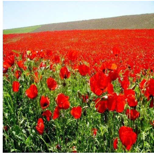
گل لاله (شقایق)

گل لاله شقایق سرخ یا کوناریان است و نام علمی آن (پاپاویر) دشت شادیان مزار شریف که روزگاری محلی در یاچه باستانی بلخ بوده است از گل های سرخ زیبا لاله (شقایق) در فصل بهار پوشیده می شود.