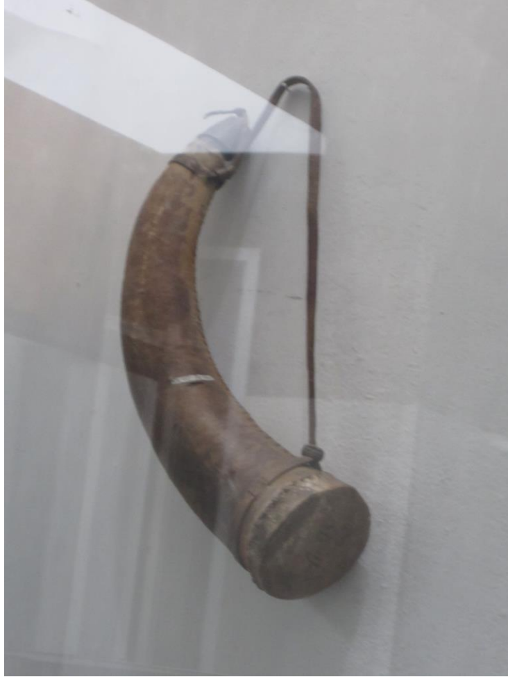
بوتل همراه چرمی آب