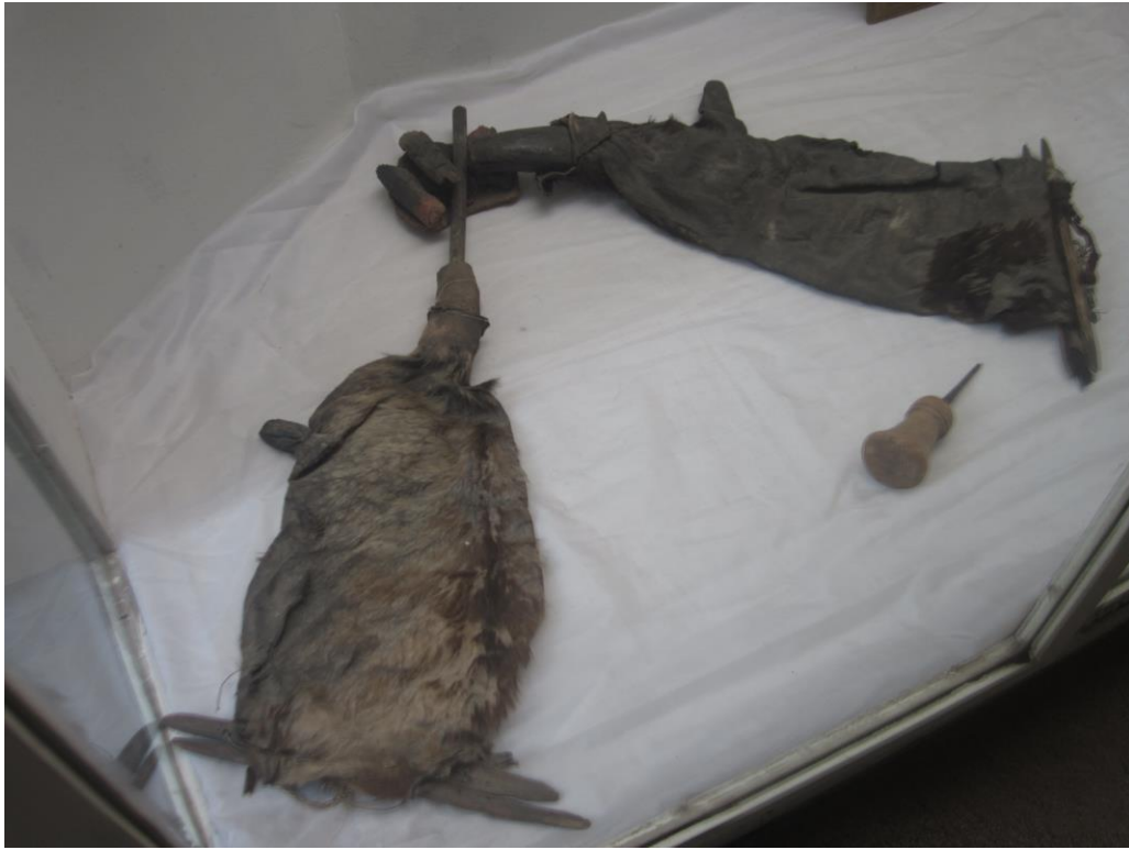
مشک ها یا بشکه هائیکه آهنگران از آن استفاده میکنند.