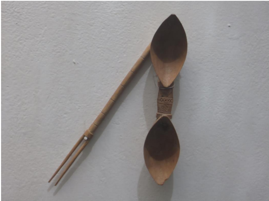
قاشق دو لبه و پنجه. با این قاشق میتوان دو نوع غذا را خورد بدون آنکه غذا ها با هم مخلوط شوند.