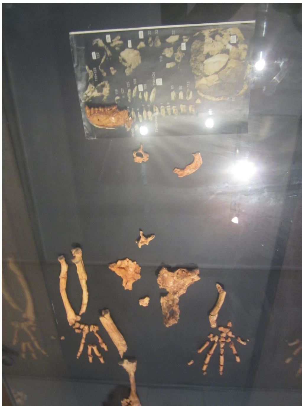
استخوان های دست Lucy

در این موزیم اشیای جالب و دیدنی زیاد بود. در اینجا چند نمونه آنرا بصورت تصویری تقدیم میدارم. متأسفانه کیفیت بعضی از عکس ها چندان خوب نمیباشد که آنها را نیز شامل این دسته تصاویر مینمودم.