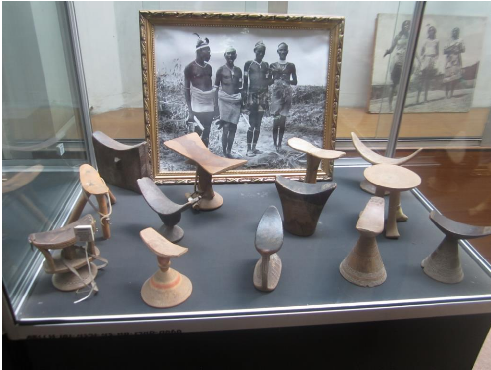
بالشت های چوبی که در قدیم از آن زیاد استفاده نموده و با خود به هر جا میبردند.