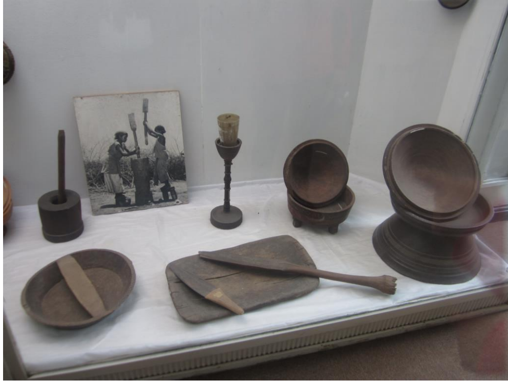
ظروف چوبی قدیمی که غربی ها بسیار از آنها کاپی نموده اند