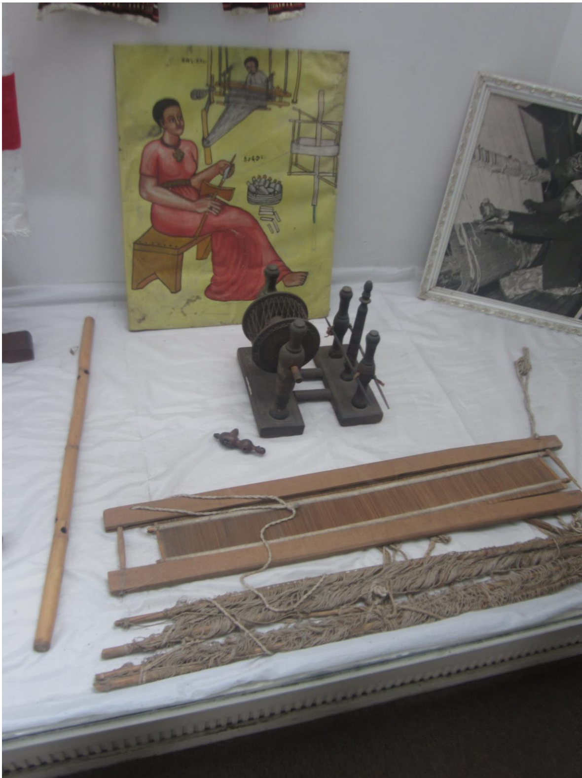
سامان آلات ریسندگی و بافندگی