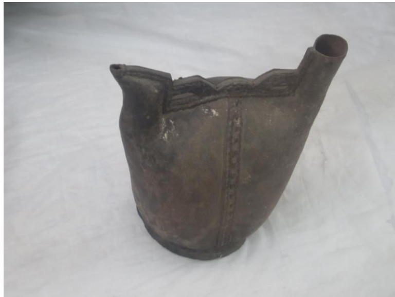
یکنوع مشک یا بوشکه