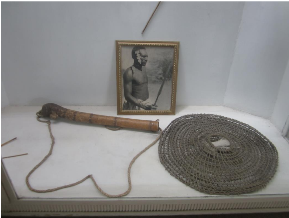
تور برای شکار