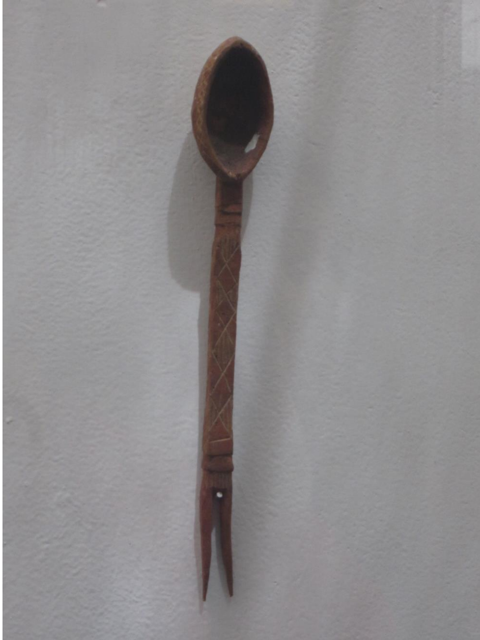
مودل دیگر قاشق-پنجه یک جائی

بیشتر مردم ایتوپیا با دست غذا میخورند. دست شوئی مانند مردم افغانستان قبل از غذا خوردن از جمله فرهنگ این مردم بوده و در وقت غذا خوردن دوستان نزدیک یکی به دهن دیگر لقمه را تعارف میکنند. و آنرا جزء دوستی می‌شمارند.