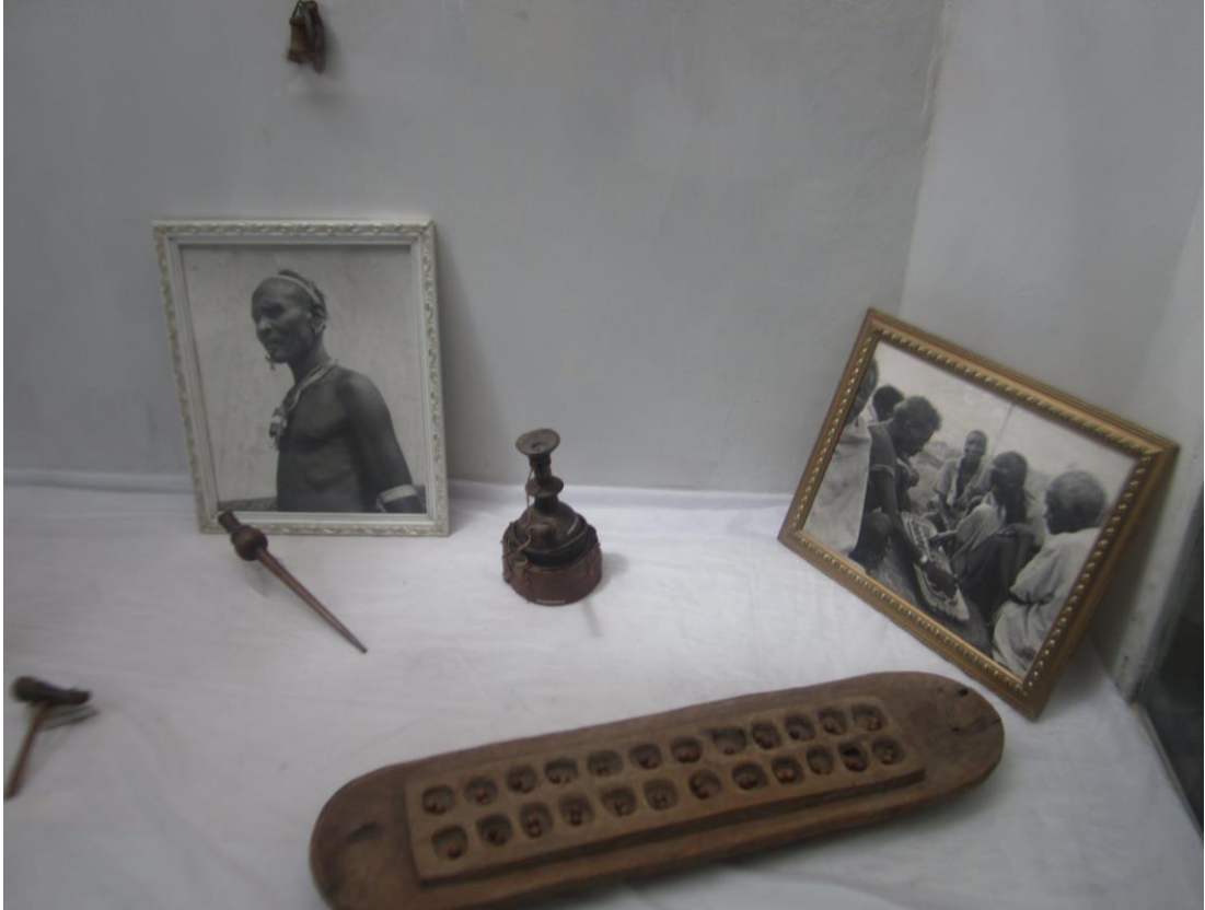
یکنوع بازی و سرگرمی