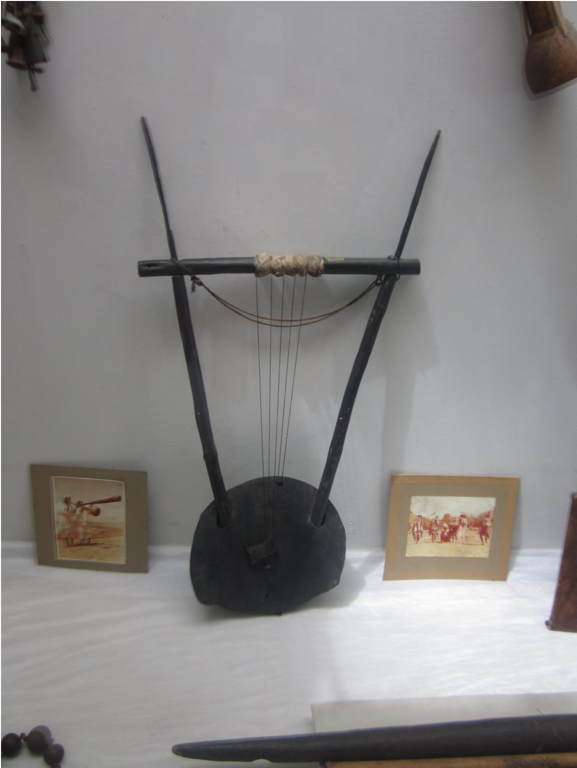
آله ديگر موسيقي تاردار