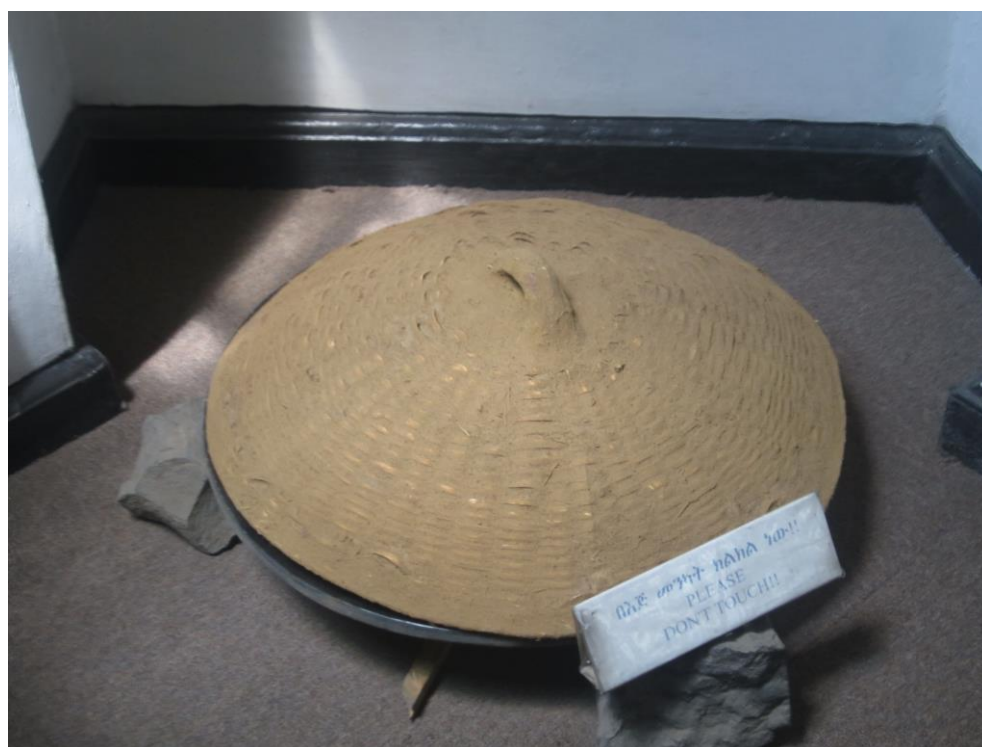
آله یکه نان هنجره بالای آن پخته میشود در عکس سرپوش آن بالایش میباشد.