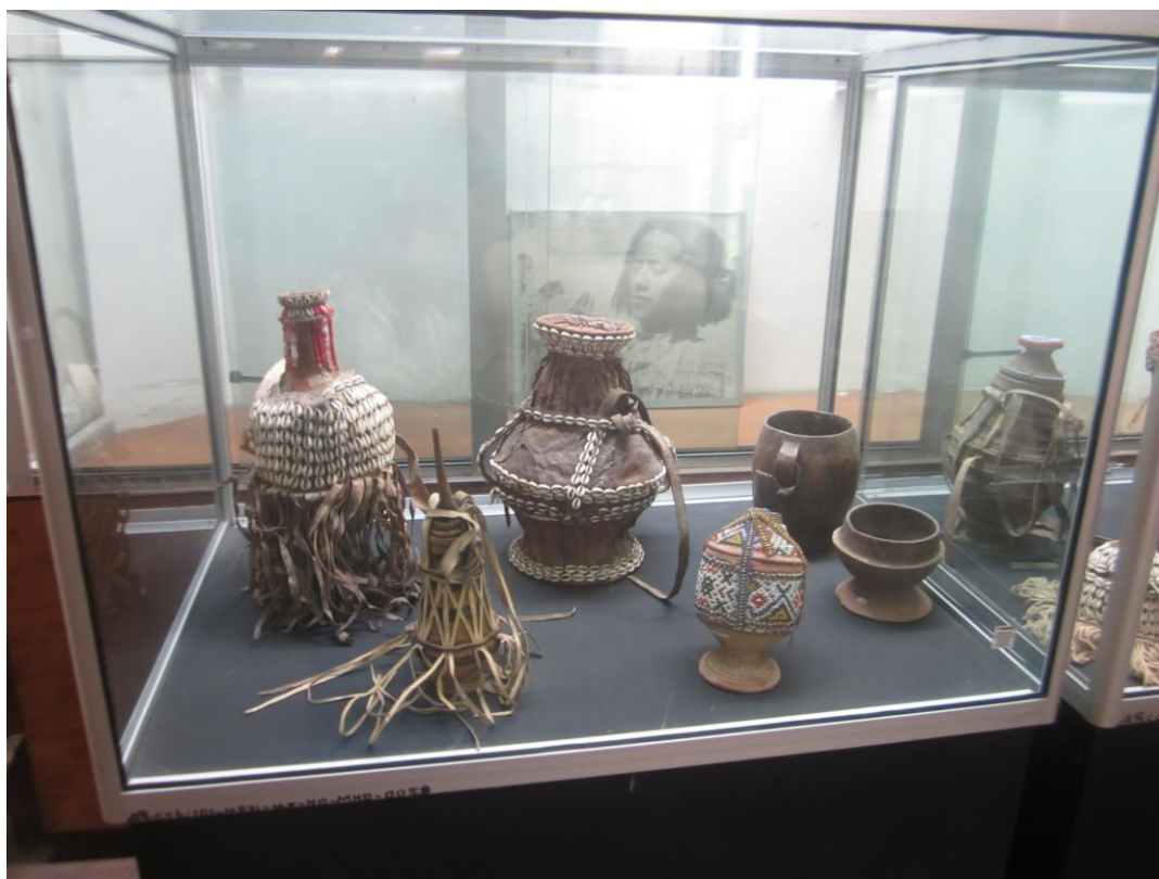
ظروف نگهداری و حمل و نقل مایعات