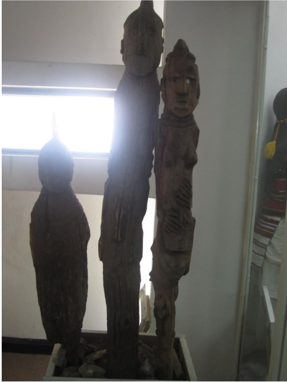
مجسمه های چوبی این موزیم شباهتی زیاد با مجسمه های چوبی نورستان داشت.