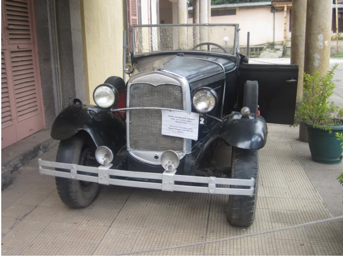
یکی از موترهائیکه بار اول داخل ایتوپیا شده است. فورد مدل T