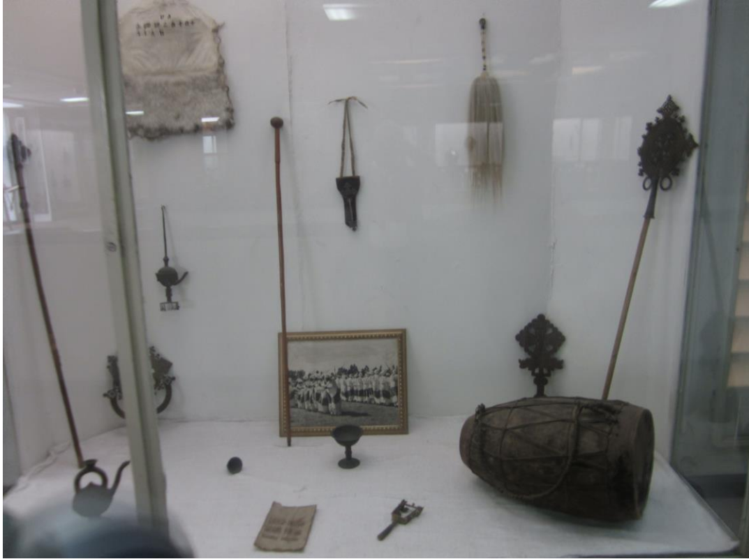
دهل و اشیای دیگر زندگی