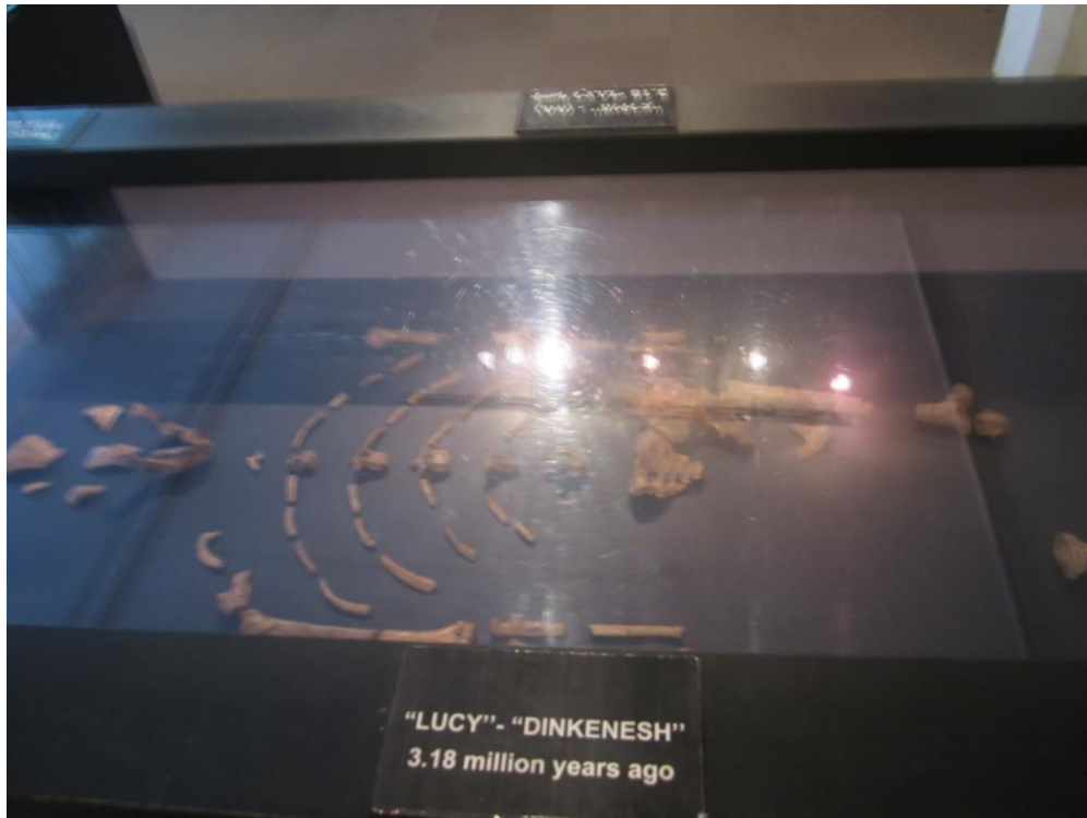
نمای دیگری از استخوان بندی Lucy