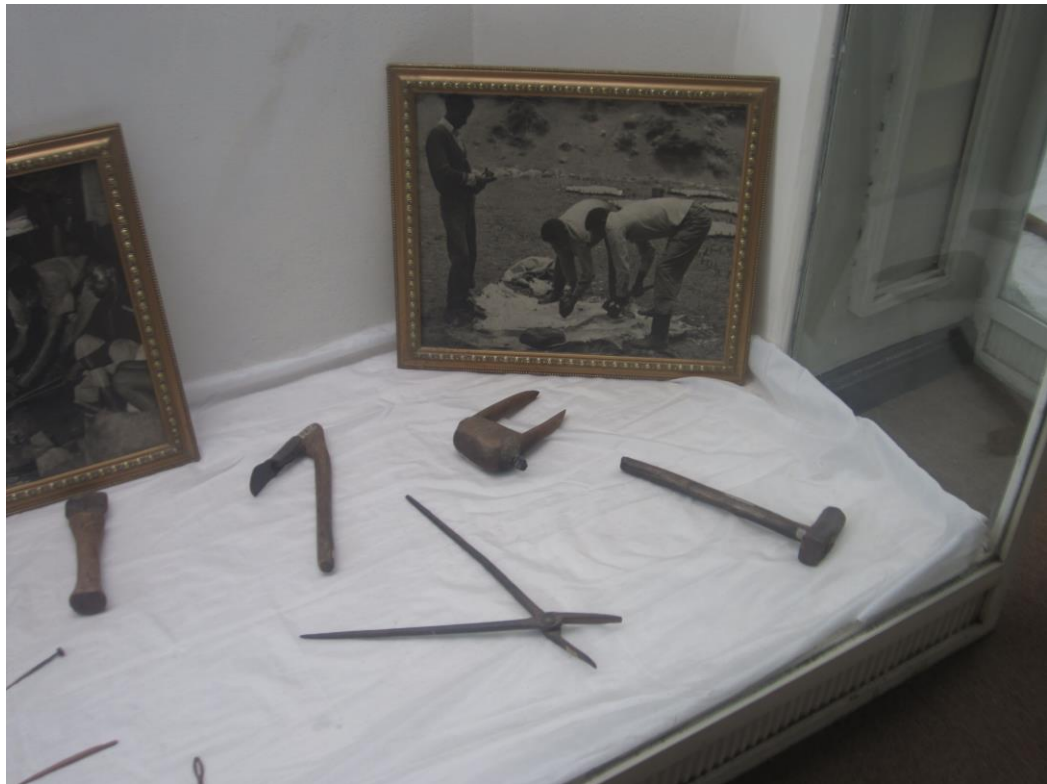
سامان آلات آهنگری و کشاورزی