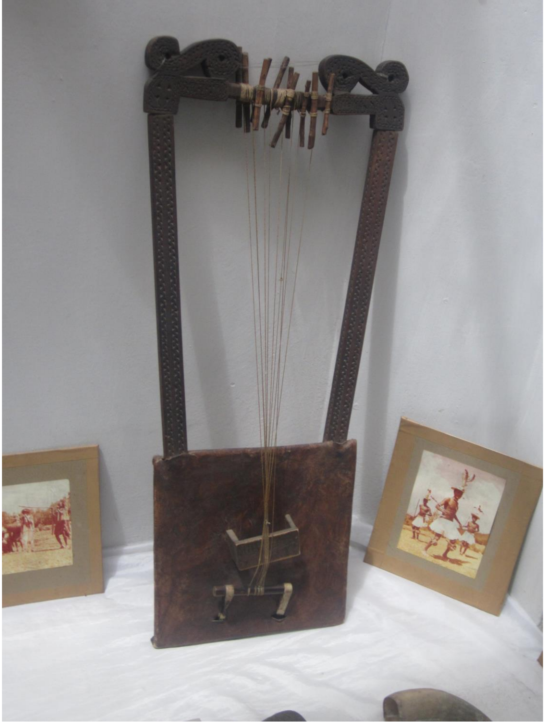
يكنوع آلة موسيقى تار دار