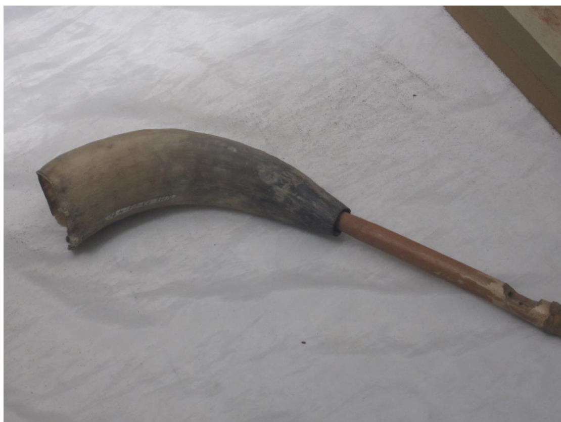
ترم از شاخ حیوانات