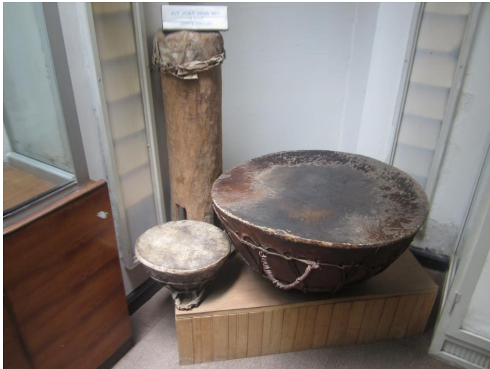
دهل های کاسه ئی. کاسه آن چوبی میباشد.