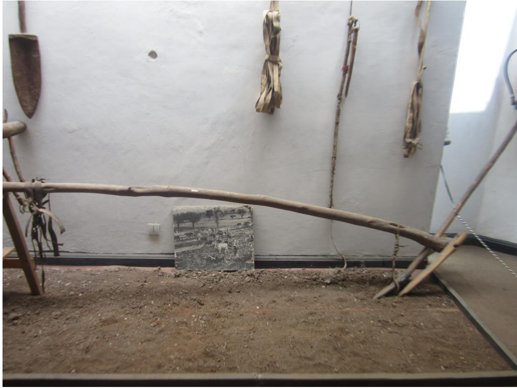
آله قلبه زمين