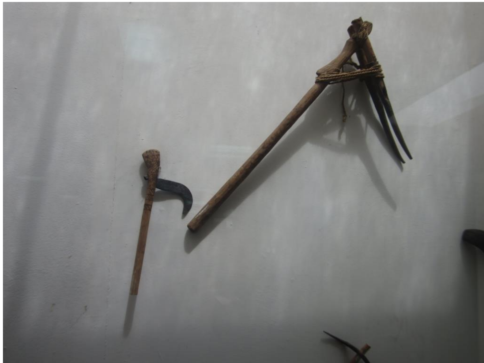
آلات دهقانان برای کشاورزی