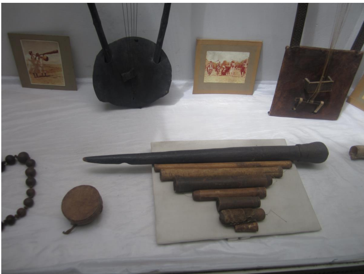
آلات موسیقی، مانند توله، تارها و دولک

مردم ایتوپیا به رقص و موسیقی علاقه فراوان دارند و هر قوم و قسمت این کشور از خود رقص، اتن و موسیقی محلی خود را دارند. تصادفاً برنامه درسی من قسمی واقع شده بود که عید قربان مسلمانان در بین بود. این بار اول بود که در برنامه های رادیویی ایتوپیا قرائت قرآن مجید را مانند خواندن های کلیسایی با موزیک شنیدم.