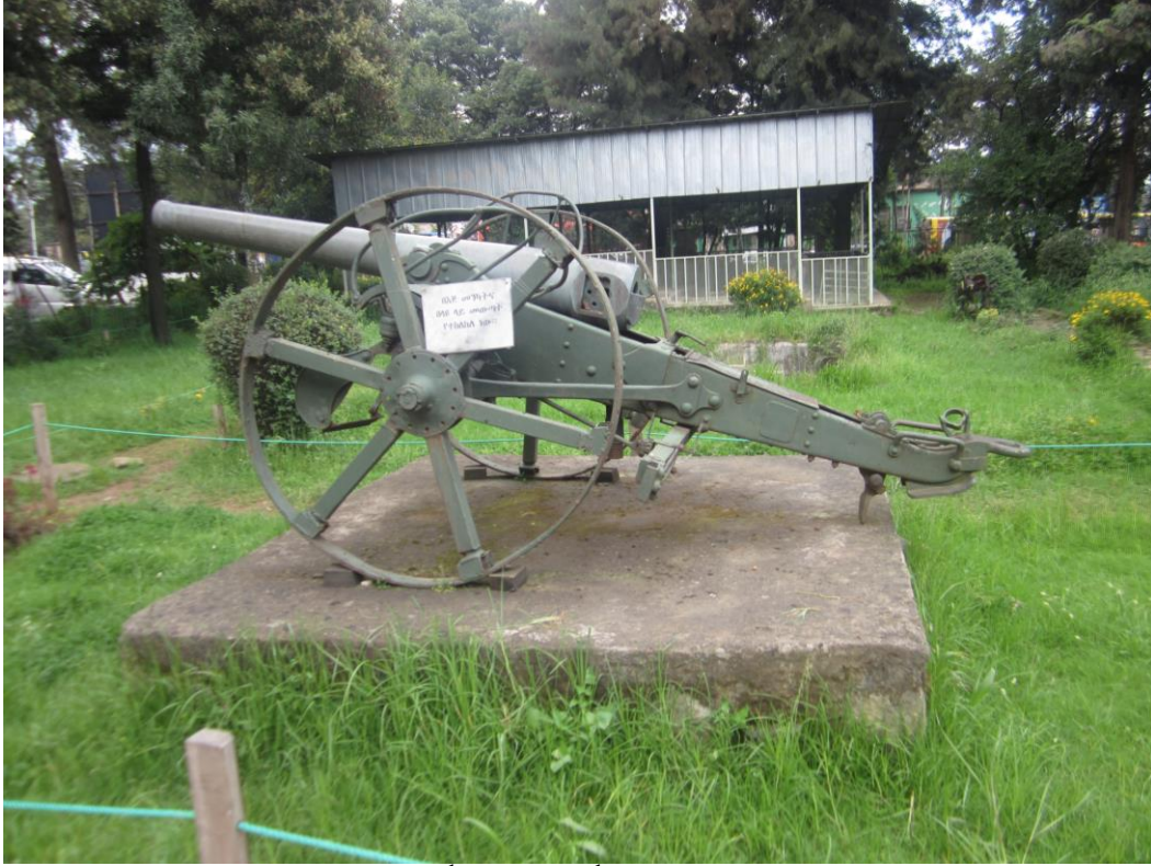
توپیکه از عساکر تجاوزگر ایتالوی گرفته شده است.