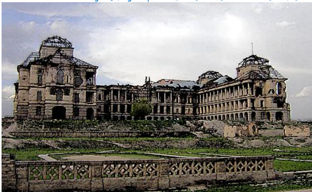
قصر بعد از سال هفتادویک و آمدن تنظیم های جهادی

قصر دارالامان از بناهای تاریخی کشور است. این ساختمان بفاصله هشت کیلومتر به طرف جنوب غرب شهر کابل، در سالهای ۱۳۰۴-۱۳۰۶ ه.ق و در زمان سلطنت امان الله خان، پادشاه ترقی خواه و زیر نظر مهندسان آلمانی ساخته شد. این قصر، حدود ۱۵۰ اتاق بزرگ و کوچک داشت که تمام دستگاه دولتی دوره امانی از آن استفاده می کردند. قصر دارالامان، از شمار هفتاد ساختمان مدرنی است که به ابتکار جوزف بریکس همراه با یک تیم ۲۲ نفر از مهندسان آلمانی و هفتصد تن کارگر افغانی طی دهسال تا سال ۱۹۲۹ میلادی در دست ساخت بود. در آن زمان، مناسبات حسنه سیاسی بین دو دولت افغانستان و آلمان برقرار بود و در امور شهرسازی و اعمار ساختمان های دولتی، این انجیران