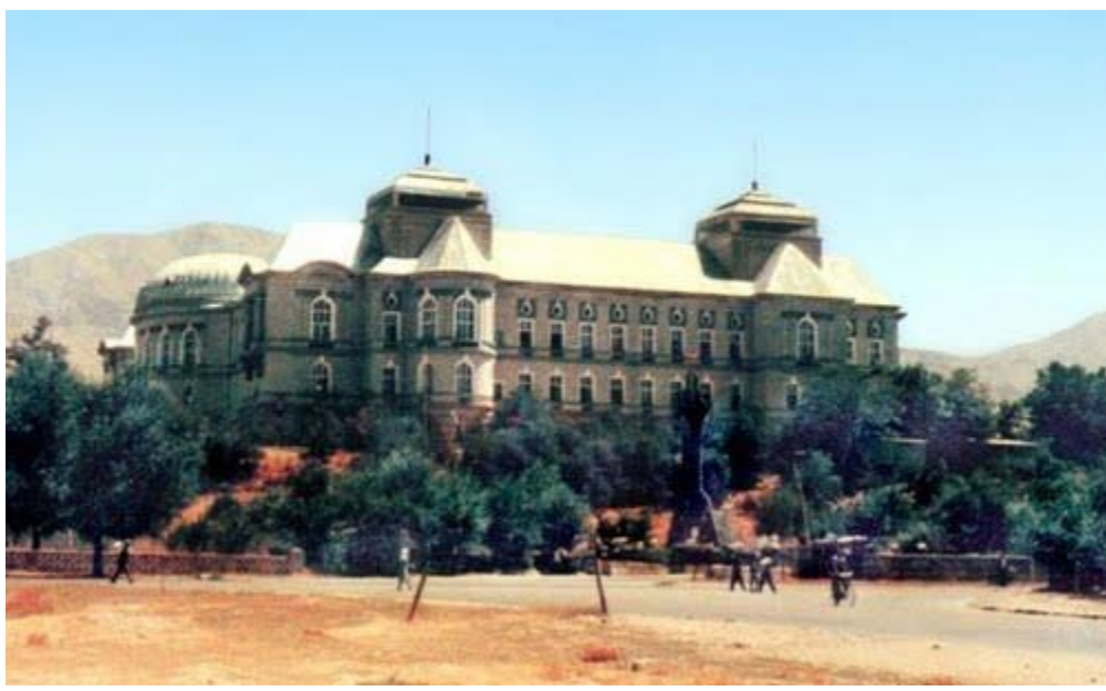
قصر قبل از سال هفتادویک و آمدن تنظیم های جهادی