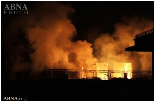
AhulBayt News Agency