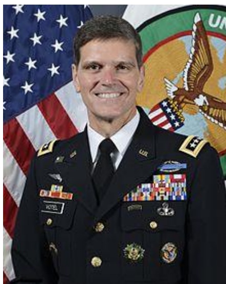
جوزف ال وتل (Joseph L. Votel)

افزون بر آن ارتش افغانستان در نظر دارد که تعداد نیروهای بویژه ای خود را دو برابر و تعداد نیروهای هوایی خود را سه برابر سازد چنانچه پیوسته به این موضوع ریس فرمانده کل نیروهای آمریکایی ایالات متحده آمریکا جنرال جوزف وتل (Joseph votel) از تمام مشاوران نظامی آمریکا که نیروهای امنیت افغانستان را از نظر آموزش مدیریت میکنند تقاضا بعمل آورد که نیروهای امنیتی افغان باید در فصل مبارزات بهاری تهاجم خود را علیه مخالفین دولت زیاد کنند چنانچه در ارتباط به همین موضوع