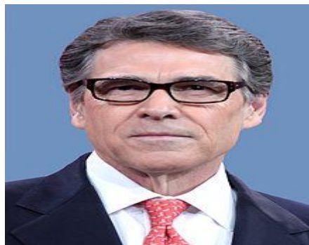
ریک پیری «وزیر انرژی امریکا در کابینه دونالد ترومپ»

از سیاست های اولین ویا نخستین ایالات متحده امریکا تا ملاحظه ویا دید برحسب تقاضای خود امریکا با بکار انداختن حملات تروریستی در این کشور وهم مردی که با امتناع از فیصله های جمعی بخاطر بهتر شدن محیط زیست؛ تغییرات آب وهوا را زیرسوال برده؛ اقدام به تهدید چین؛ دامن زدن به آتش وخشم درجهان که هرگز قبلاً دیده نشده است ویا اینکه ریس جمهور کشور های دیگر زبان (که به زبان های دیگر صحبت میکنند) را بعنوان ریس جمهور غیررسمی وغیر قانونی معرفی کردند وبه ادرس کشورهای مشابه واژه ای مستراح وتوالت را بکار بردن ویا تحت پوشش قرار دادن وبه جنرال های خود دست آزاد دادن که درجنگ علیه تروریزم برنده میشوند میتوان گفت که موارد نگران کننده و خنده آوراست اما یک نسخه ای کاملاً پرتطرفدار آنچه که پیش از این صورت گرفته؛ او این احساس را دارد که نمای وقار وکرامت ریاست جمهوری امپریالیستی را به کنا رگذارد وبما اجازه میدهد آنچه که اوامر امپریالیستی (قدرتمندی) است بروی آن دقت کنیم او همچنان درتلاش است که راه های جدید کاملاً از واقعیت های گذشته وقدمی را بمان نشان میدهد ازاینکه قدرت ونیرومندی امریکا چگونه میتواند نیروی برای تخریب احتمالاً کل سیاره ما است. حالانکه شما فقط درمورد طوری فکر میکنید که فولکس واگون دونالد ترومپ (یا شاید که منظور من هواپیما خصوصی ویا لوازم ووسایل طلایی حمام اوباشد) با دیگر دلچک ها پُر ومالا مال است؛ دلچک های که با عمل همسان وهمانند خود لرزه دراستخوانها می اندازند، همچنان اجازه دهید که از سکا ت پریوت (Scott Pruitt) وزیر محافظت محیط زیست ومدیر تعداد از محافظان مسول صحت وسلامتی ما؛ ریک پیری (Rick Perry) وزیر انرژی ومدیر