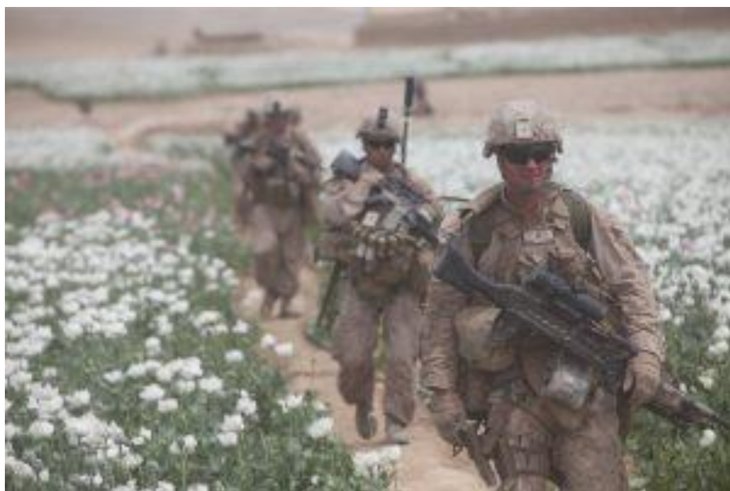
حفاظت مزرعه تریاک توسط گز مه ای امریکائی

حملات تروریستی وضع را وخیمتر ساخته فرصتی به عادی ساختن اوضاع نمیدهد. بر علاوه طالبان ساحات وسیعی را کنترل نموده و از پشتیبانی مردم در آن ساحات برخوردارند. در چنین وضع دولت افغانستان اقلن به خاطر حفظ حتی مشروعیت ظاهری اش باید به آرای مردم اهمیت بدهد. معهذ گمان نمیرود که از دید پرسونل نظامی امریکا بالای پروسه صلح موثر باشد، در حالیکه ایالات متحده هنوز هم پلان دارد تا به حیث یک بازیکن کلیدی در افغانستان که برایش اهمیت ستراتیژیک دارد باقی بماند.