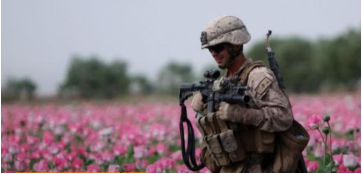
حفاظت مزرعه تریاک توسط عسکر امریکائی