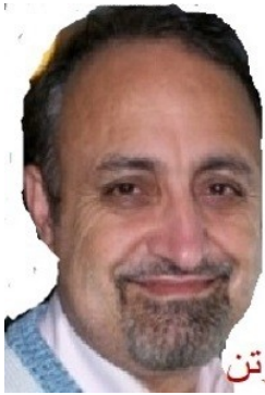
تحلیل و نگارگری: محمد امین فروتن