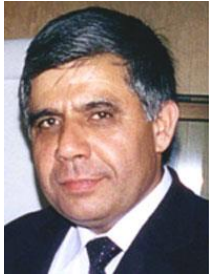
میر عبدالواحد سادات