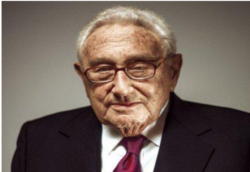
هنري کيسنجر (نامتو اشراف)

The “Secrete Agenda” of the so called Elite to the final battle