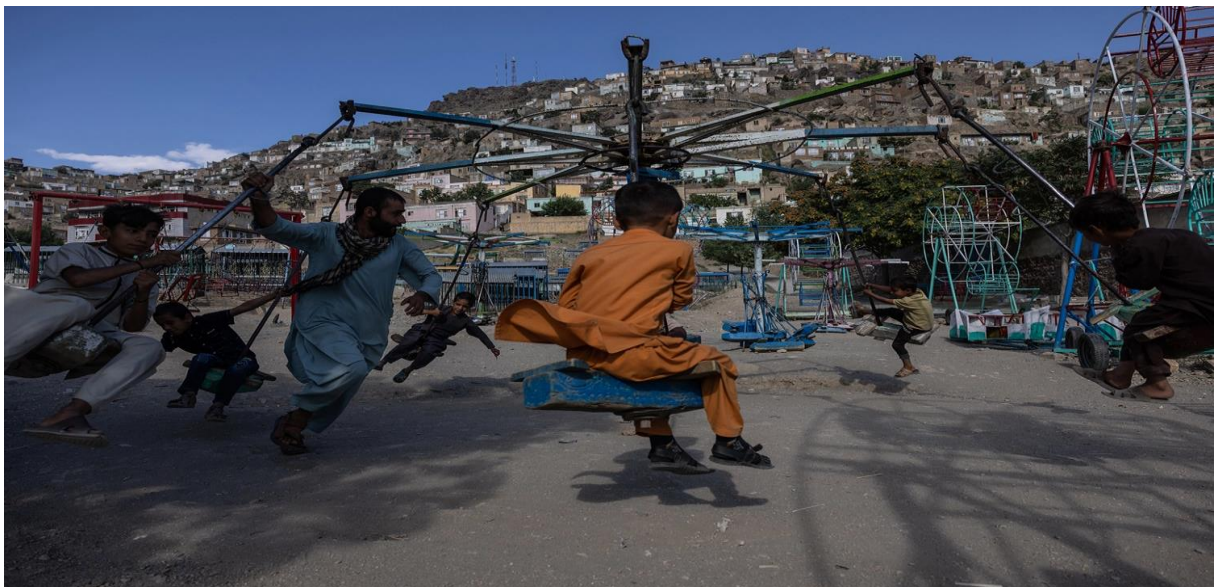
کودکان در 19 ژوئن در کابل در بیرون از خانه بازی می‌کنند. شهر هنوز مزدحم است اما روحیه خود را از دست داده است.