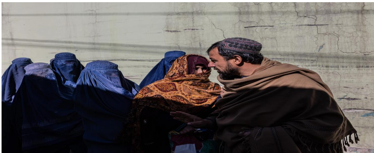
مردی از کنار گروهی از زنان محجبه در کابل می گذرد