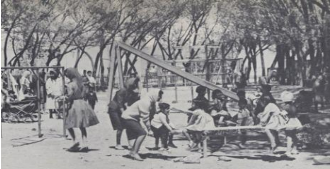
مادران و کودکان در حال بازی در پارک شهری - بدون همراهان مرد