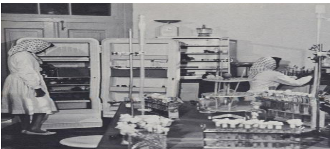
زنان شاغل در یکی از آزمایشگاه های مرکز تحقیقات واکسن