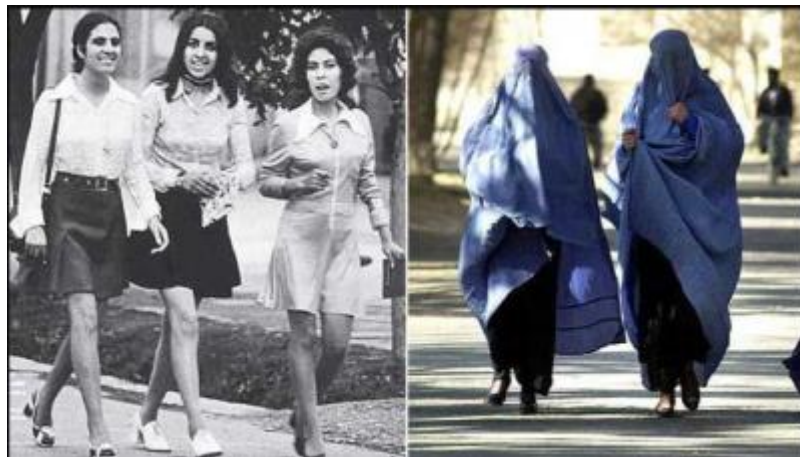
پیش از جنگ

The CIA Sponsored Islamic Insurgency (1979- )