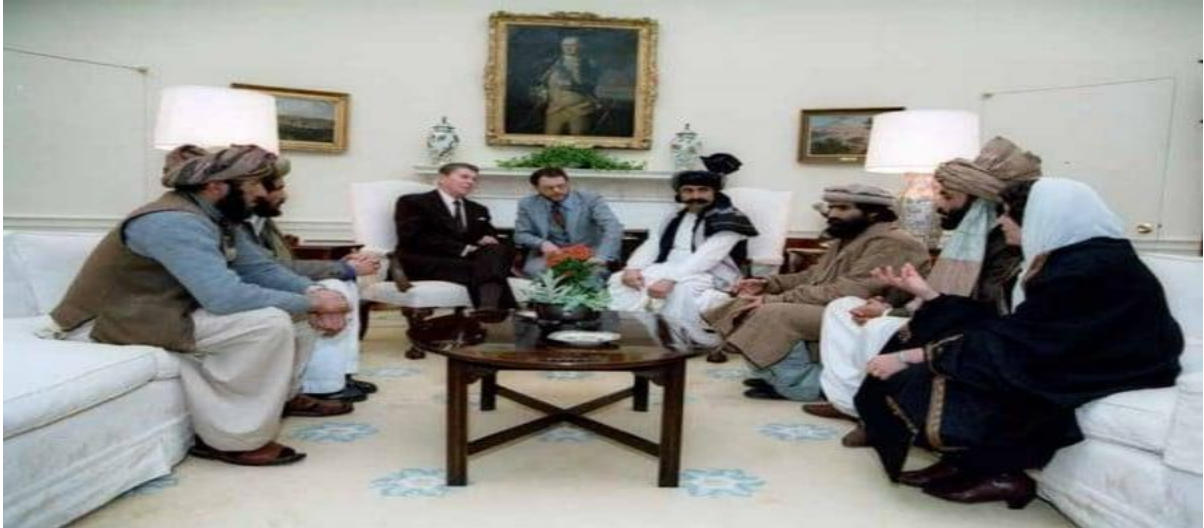
ملاقات ریگان با مجاهدین افغان