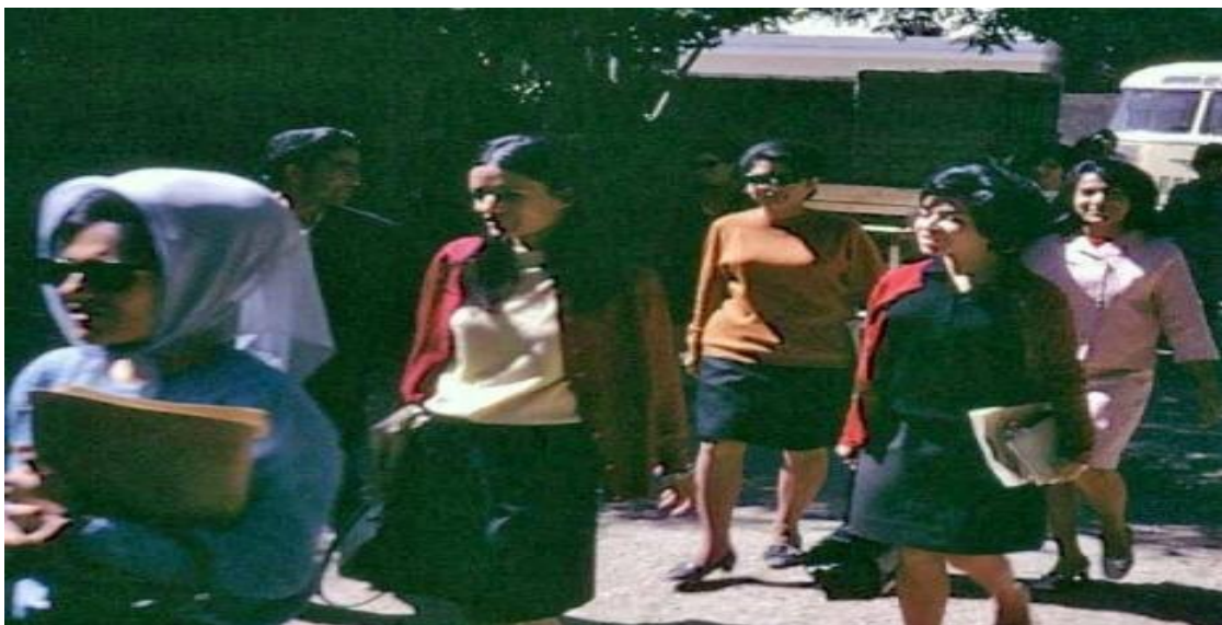
ترانسپورت در کابل یا گشت و گذر آزاد زنان در کابل