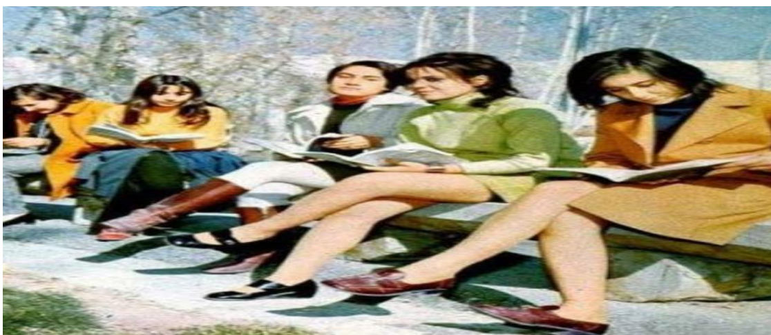
دانشجویان دانشگاه، کابل در اوایل دهه 1970