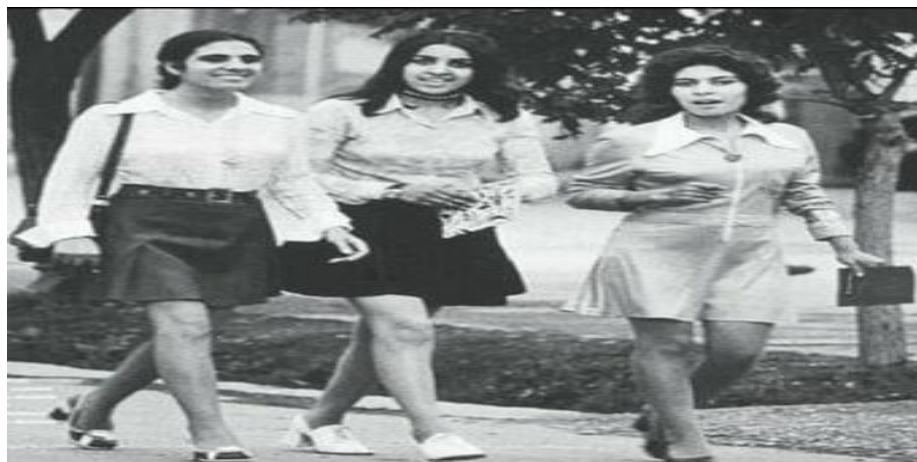
دختران پوهنتون کابل در هنگام قدم زدن در صحنه پوهنتون کابل

دانشگاه و 40 درصد داکتران در کابل زن بودند ( واما . دفتر دموکراسی و حقوق بشر، وزارت امور خارجه ایالات متحده، بعد از 2001 ، پیوند دیگر کارایی ندارد )