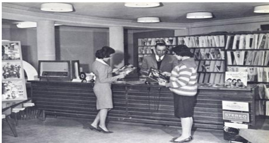
یک فروشگاه موسیقی در کابل