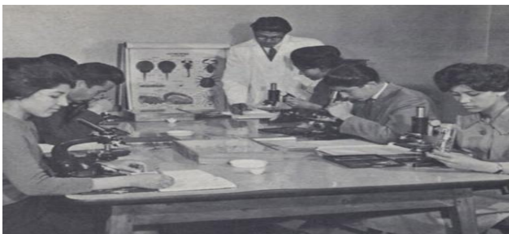
یک کلاس زیست شناسی در دانشگاه کابل