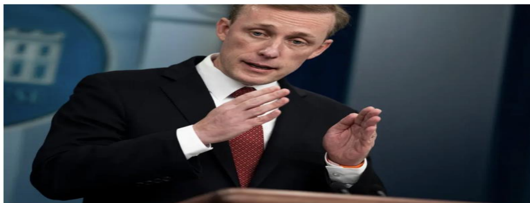
Jake Sullivan, President Biden's national security adviser, at the White House earlier this month.

سالیوان، مشاور امنیت ملی با یدن، و مک گورک، فرصت طلبان تمام عیار، بوروکرات های ماکیا ولیستی هستند که به مراکز قدرت از جمله لابی اسرائیل پاسخ می دهند .