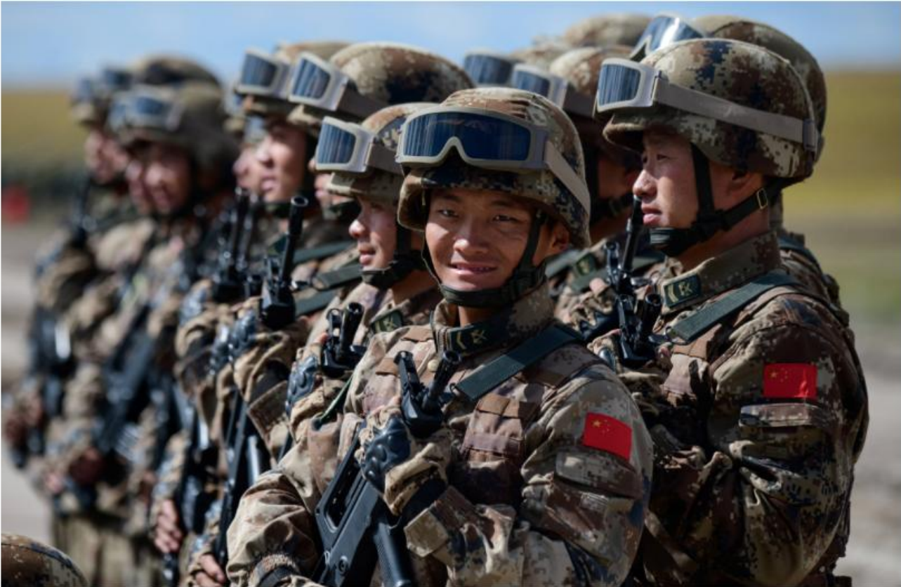
The Chinese media have described the People's Liberation Army involvement in the drills as the country's largest-ever dispatch of forces abroad for war games.