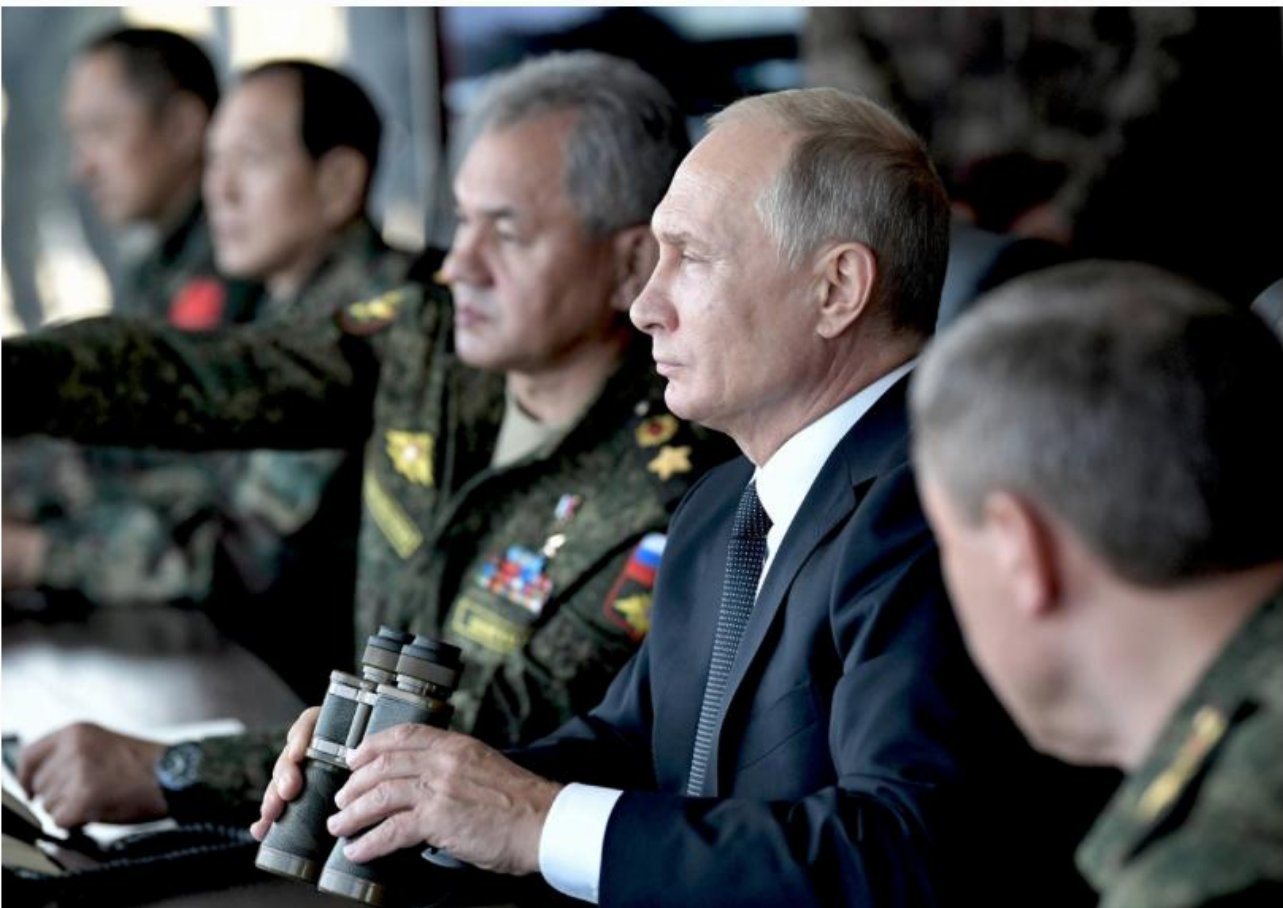
President Vladimir Putin lauded Russian, Chinese and Mongolian troops for their skills, saying they 'demonstrated their capability to deflect potential military threats'.