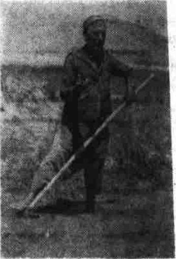
تازه آب زندگی در جویش راهی شده است

که آنهم گاه می پیدا می شد و گاه می گشتن می خوابیدم زندگی کنیم حالا که دولت ما غمخور ماست دیگر سودای نداریم و میتوانیم همان بیدا گری های ما را کسه