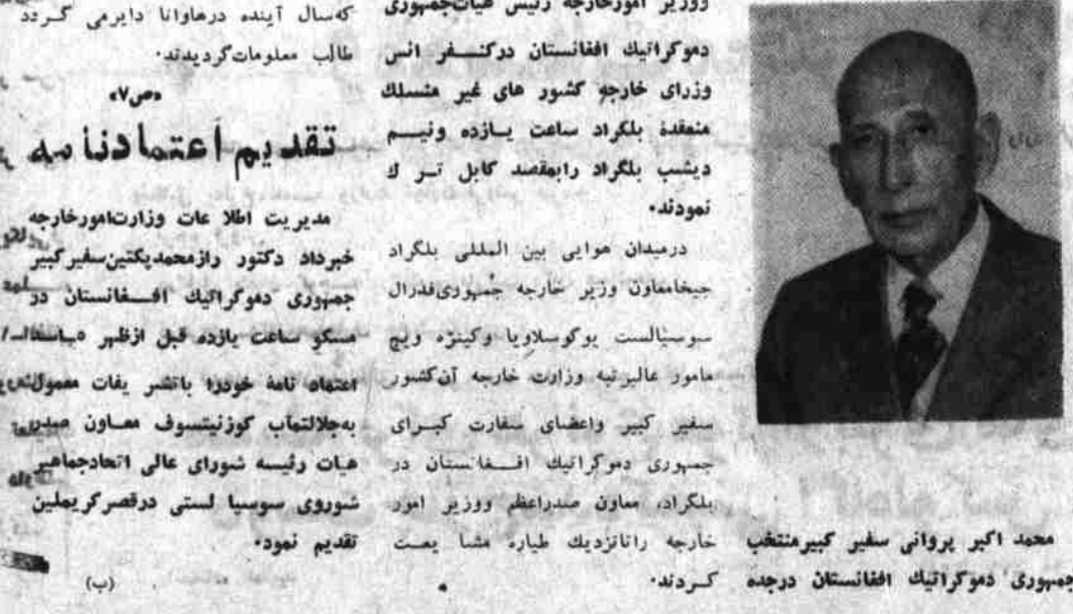
محمد اکبر پروانی سفیر کبیر منتخب جمهوری دموکراتيک افغانستان درجه

مدیریت اطلاعات وزارت امور خارجه اخیراً در گریمان محمد اکبر پروانی که بحیث سفیر کبیر جمهوری دموکراتيک افغانستان در چند از دولت عربستان سعودی مطالبه شده بود، اخیراً مواصلت کرده است. (مختصر سوانح ص ۸)