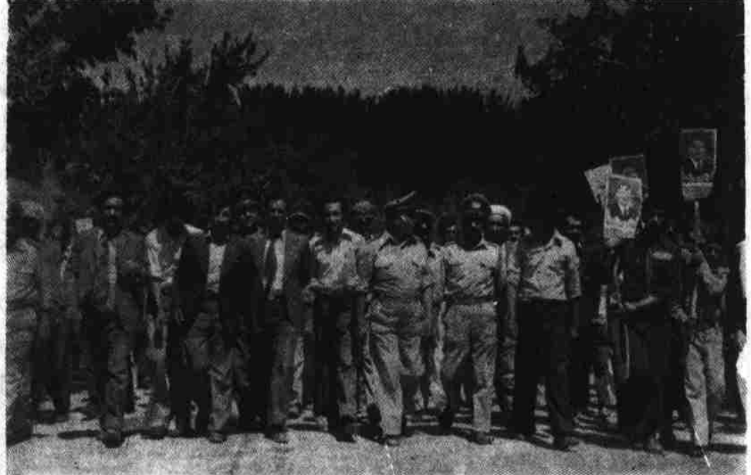
مردم هرات پیروزی انقلاب را با برانداختن مارش تجلیل نمودند.

او در حالیکه دستا نش را به طرف آسمان بالا کرده و دوام عمر نور محمد تره کی رئیس شو رای انقلابی و صدراعظم و دیگر رفقای انقلابی اش را خواستار شد گفت: خوش هستم که بفرمایین صاحب، مهربانی کنین خان صاحب، از میان برداشته