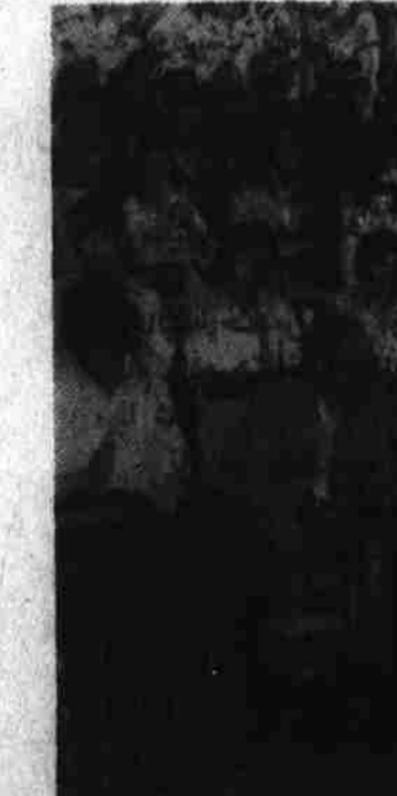
عبدالقدوس غوربندی وزیر تجارت هنگام ایراد بیانیه در مطیقه به مناسبت تعدیل کارگران روز مزد دافغان میوی سمون شرکت به کارگران

حزبی و دولتی جمهوری دموکراتيک افغانستان ساعت شش عصر شامیندر مراسم بیست و پنجمین سالگرد انقلاب کبیرا منقده شهر ساتیاگو سبیم گرفت. ملاقات تعارفی با مقامات و رؤسای هیات عالی رتبه حزبی و دولتی جمهوری دموکراتيک افغانستان و وزیر صحت عامه عبدالکریم سیسی میثاق عضو بسوز روی سیاسی است. یازده قبل از ظهر پیروزوز در سفیر کبیر دیالات مستقیم در کابل وزارت و در میان هوایی از سفر طوری که در برنامه جریده تاپناک خلق افغانستان از نمایان آن تدارک انعامیته کميته مرکزی حزب حکومت داده بودیم اکنون یک بار دیگر تاکید میکنیم که بعد حذف ستراتیژیک که