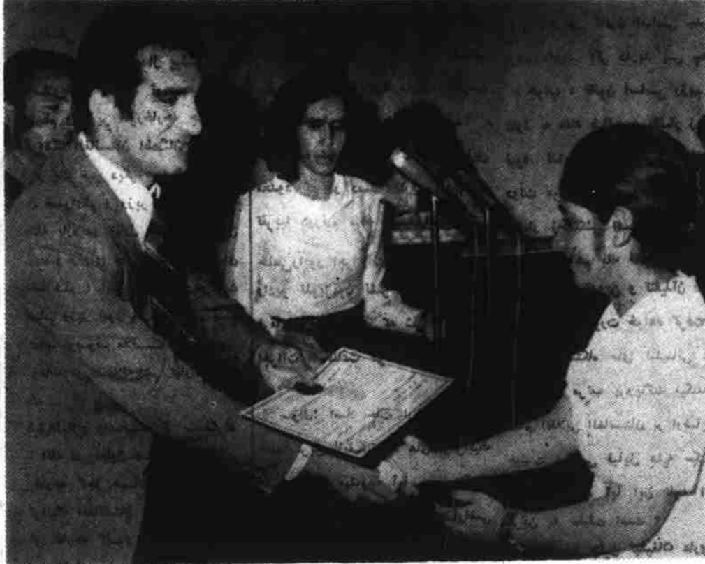
دکتور اسدالله امین معین وزارت صحت عامه هنگامیکه شهادتنامه بکتن فارغان مکتب نرس قابلۀ ننگرهار وکاسی باختره

هیات مختلط وزارتخانه های هواپیمایی، صحت عامه و ریاست آمدگی ضد حوادث صدمات عظیمی بشمول نماینده آژانس باختر که سه روز قبل به منظور و ارسی از مناطق آسیب رسیده سیلاب اخیر وارد میدان شهر هرگز ولایت وردک گردیده بود کار خود را در آن ولایت خاتمه داده و پریروز به همین منظور بصوب ولایت غزنی، نابل و ارزگان حرکت کرد. یک منبع ولایت وردک گفت هیات متذکره از مناطق آسیب دیده آن ولایت بازدید نموده در زمینه ناپوری قدیم نبود. منبع افزود در آن سرازیر شدن سیلاب های اخیر مرکز مریوطات ولایت وردک هشت نفر هلاک و بیست و پنج میلیون و دوصدو چار ده هزارو یکصدو هشتاد افغانی خسارت مالی وارد گردیده است.