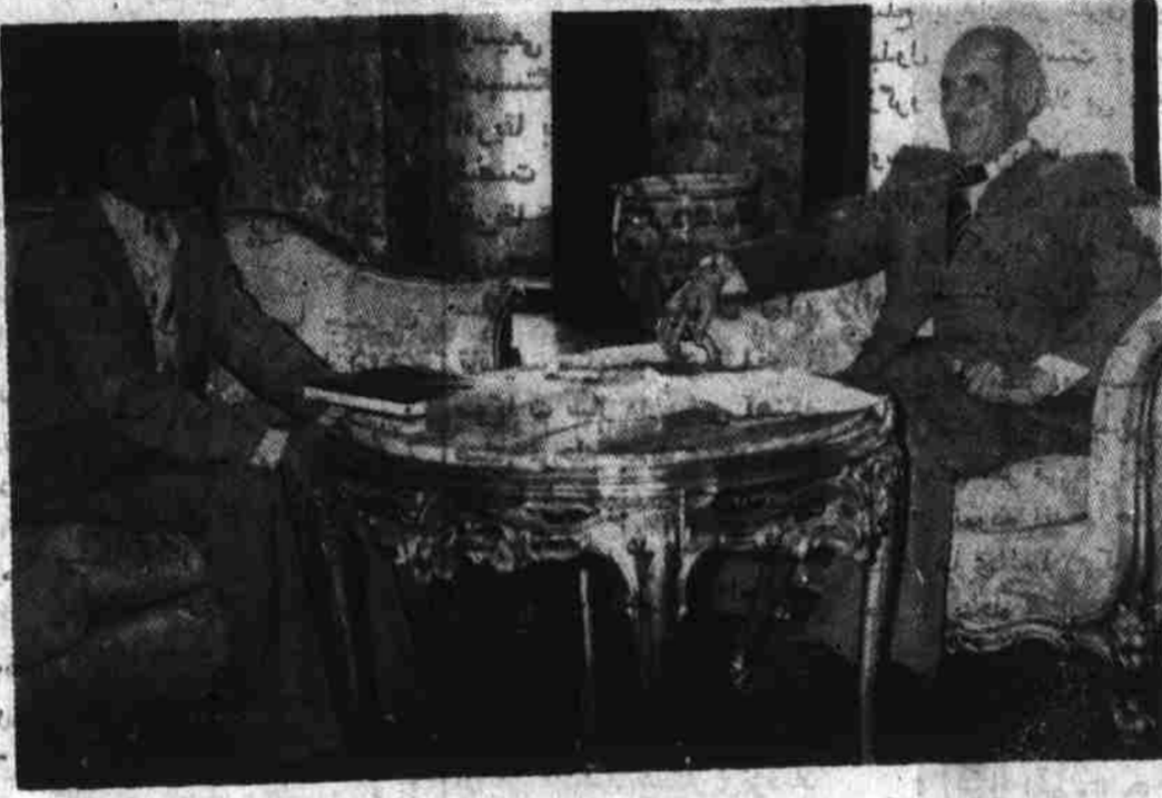
نور محمد ترهکي رئيس شوراي انقلابي و صدر اعظم هنگام تبار پاکستانی

صدراعظم جمهوری دموکراتيک افغانستان ساعت سه بعد از ظهر روز سه شنبه سوم اسد ۱۳۵۷ مجاهد علی روز نامه نگار پاکستانی را بحضور خود پذیرفتند بعد از صحبت دوستانه مختصر مصاحبه چنین آغاز شد. سوال : چه عاملی موجب آن شد تا در این مرحله تاریخ و جامعه افغانستان انقلاب نمایند ؟ جواب : فقر و محرومیت های روز افزون مادی و معنوی خلق های کشور و من و همه اعضای مبارز و صدیق حزب دموکراتيک خلق افغانستان را چه در اردو وجه دولتی و داشت که یسوع استبداد و استثمار اوستوکراسی افغانستان را که از حمایت و پشتیبانی مستقیم ارتجاع و امپریالیزم بین المللی برخوردار بود، سقوط دهم و راه را