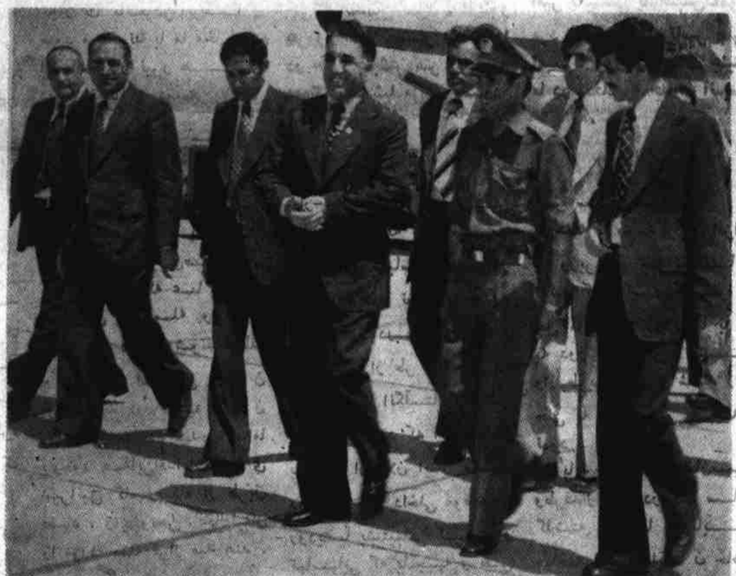
حفیظ الله امین معاون صدراعظم و وزیر امور خارجه هنگام مواصلت در میدان هوایی بین المللی کابل

طبق اطلاع واصله از هاوانا، اعضای هیات عالی رتبه حزبی و دولتی جمهوری دموکراتيک افغانستان تشکیل از دکتور شاه ولی عضو دارالانشاء و بوروي سياسي کميته مرکزي حزب دموکراتيک خلق افغانستان و وزیر صحت عامه عبدالکریم سیسی میثاق عضو بسوز روی سیاسی است. یازده قبل از ظهر پیروزوز در سفیر کبیر دیالات مستقیم در کابل وزارت و در میان هوایی از سفر طوری که در برنامه جریده تاپناک خلق افغانستان از نمایان آن تدارک انعامیته کميته مرکزی حزب حکومت داده بودیم اکنون یک بار دیگر تاکید میکنیم که بعد حذف ستراتیژیک که