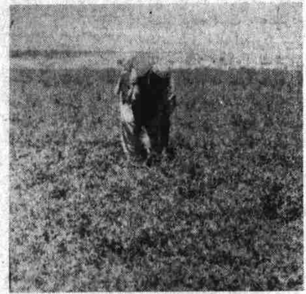
این کمرسالها زیر بار دیگران خم بود .