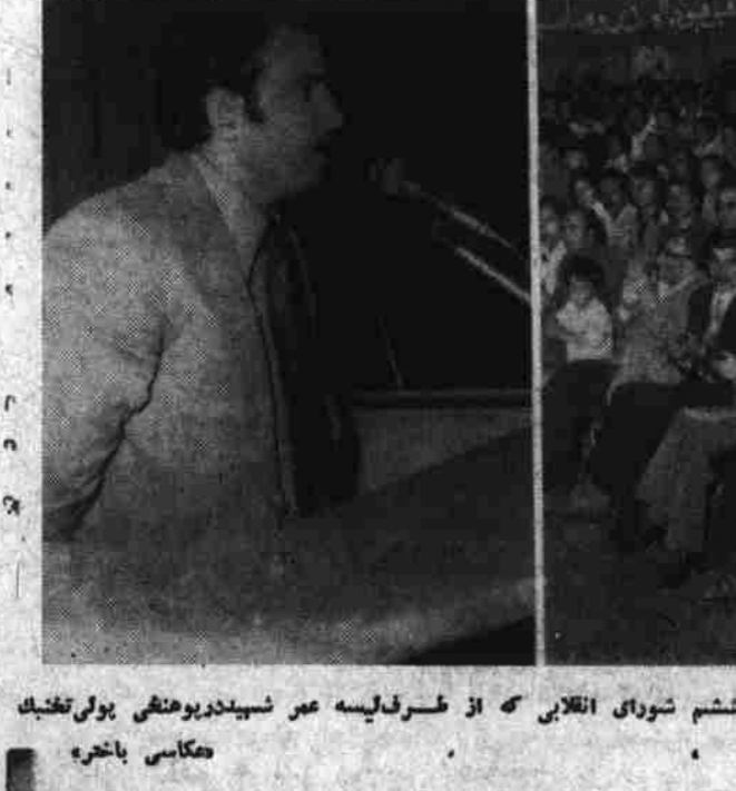
عبدالقادر آشتا هنگام ایراد بیانیه در مراسم تجلیل از افلاذ فرمان شماره ششم شورای انقلابی که از طرف لیسه عمر شهید پوهنشی پولی تخنیک ترتیب شده بود

روز پنجشنبه مطابق ۱۳ ماه مبارک رمضان اطار ۱۰ه۰ دقیقه ۳۰ تا ۱۰ه۰ دقیقه ۰۱