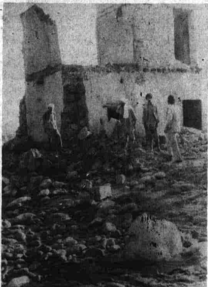
خرابه های سیلابهای اخیر در ولایت لغمان

میکند گفت: جمعیت افغانی سره میاشت اصلاحاتون کمک و خدمت به بینوایان و مستمندان است و تا حد توان از کمک به مستحقان دریغ نمی کند. اما اصولا امداد های جمعیت آتی و عاجل است و در هر حله حادثه در قلب مشکلات یکی است و همچنان هم روح همکار ی در ریخ نقوا هد جمعیت افغانی سره میاشت اصلاحاتون کمک و خدمت به بینوایان و مستمندان است و تا حد توان از کمک به مستحقان دریغ نمی کند. اما اصولا امداد های جمعیت آتی و عاجل است و در هر حله حادثه در قلب مشکلات یکی است و همچنان هم روح