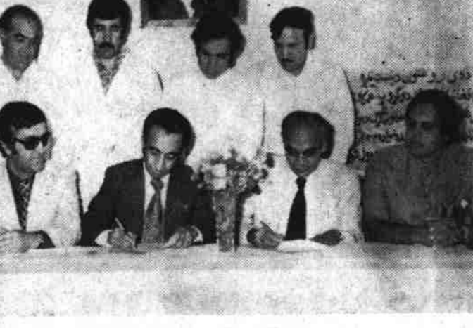
رئیس موسسه صحت طفل و آمر عمومی شفا خانه آل اندیا انستیتوت اف هدیکل ساینس هنگام امضای یادداشت تفاهمی در موسسه صحت طفل