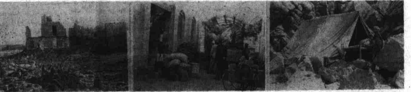
نمونه ای از فعالیت یونیت های سیار جمعیت افغانی سره میاشت در ولایت لغمان