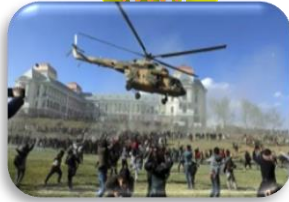
برجسته ترین رویداد این ماه