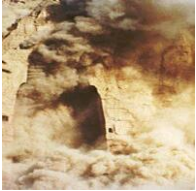
1, En hemmelig skole hænderne 5. Budas statuen