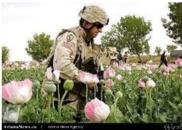
Stigning of Upium in Afghinistan

Billederne fortæller om situationen i Afghanistan fra de seneste måneder i 2008